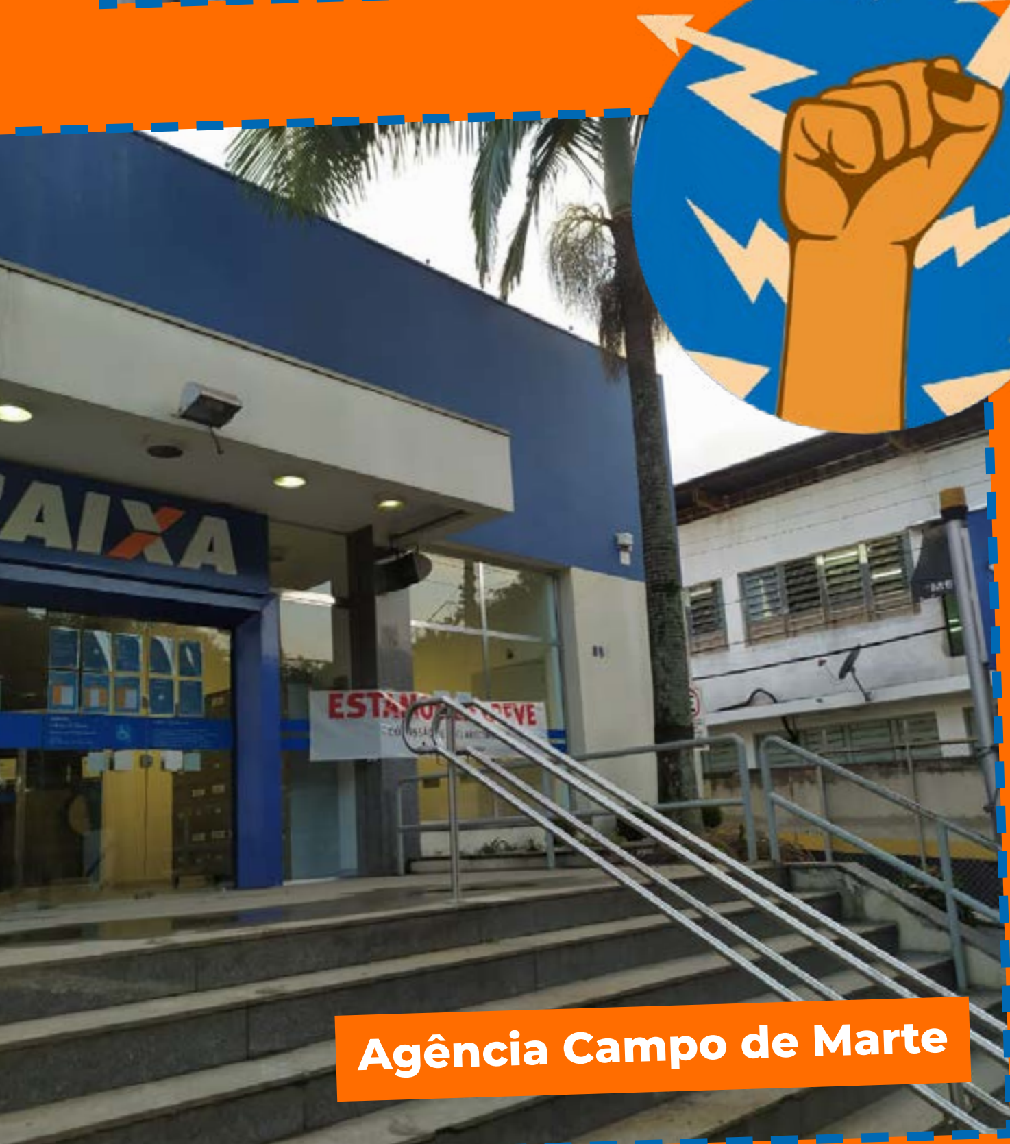
Agência Campo de Marte