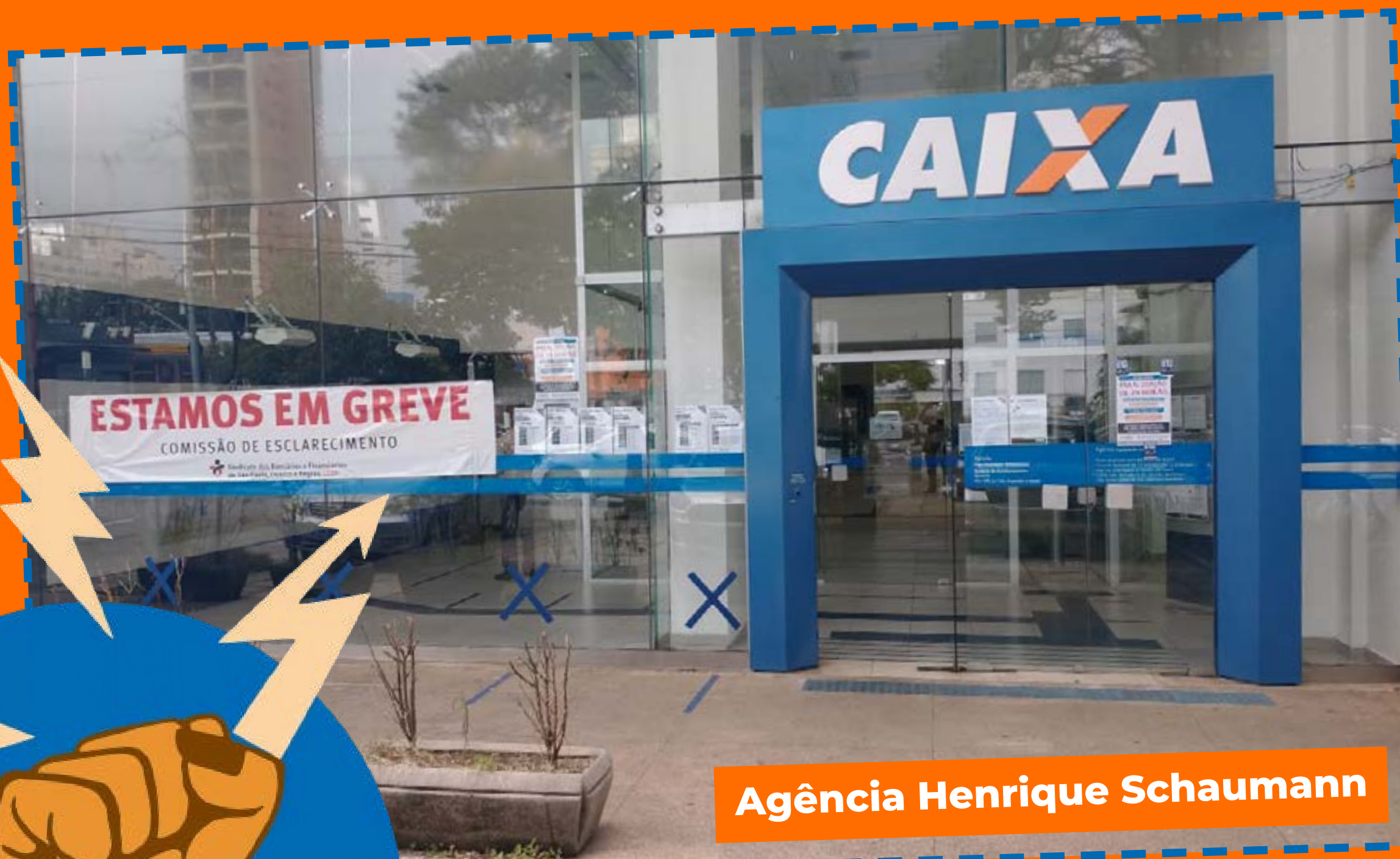
Agência Henrique Schaumann