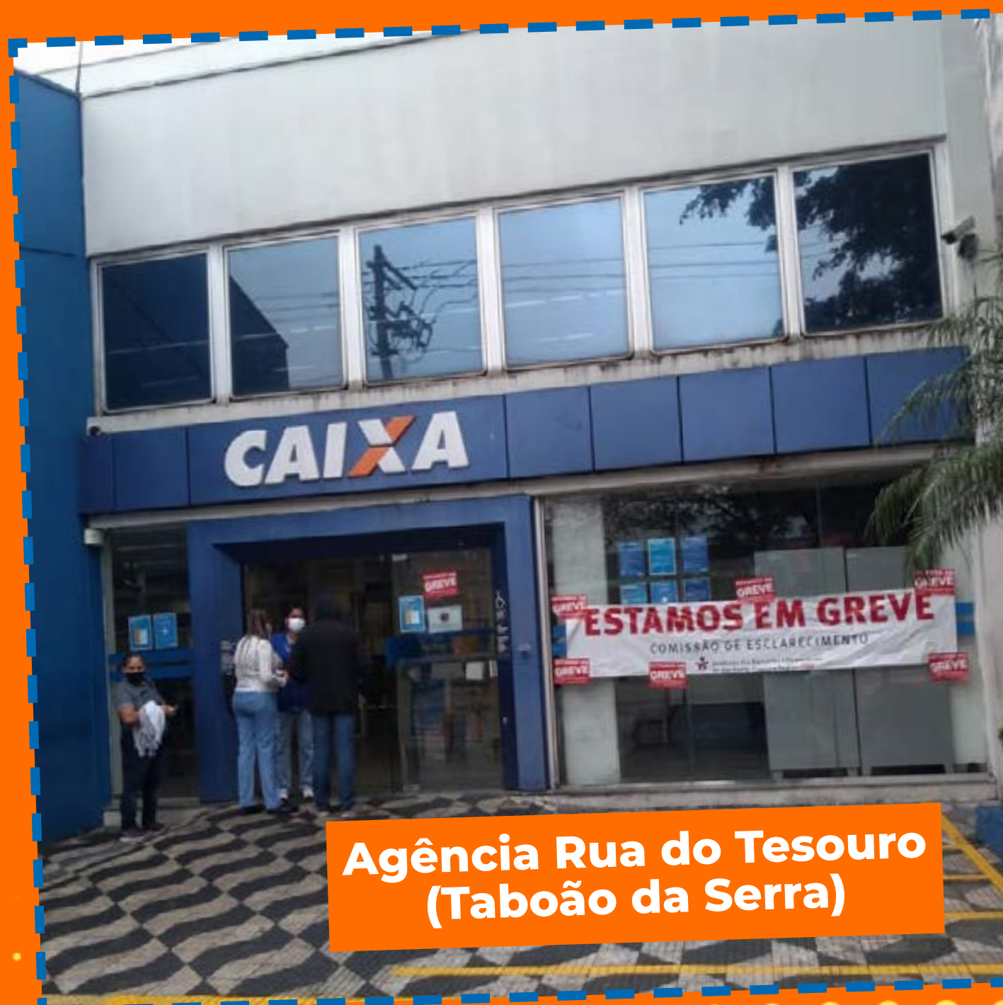
Agência Rua do Tesouro (Taboão da Serra)