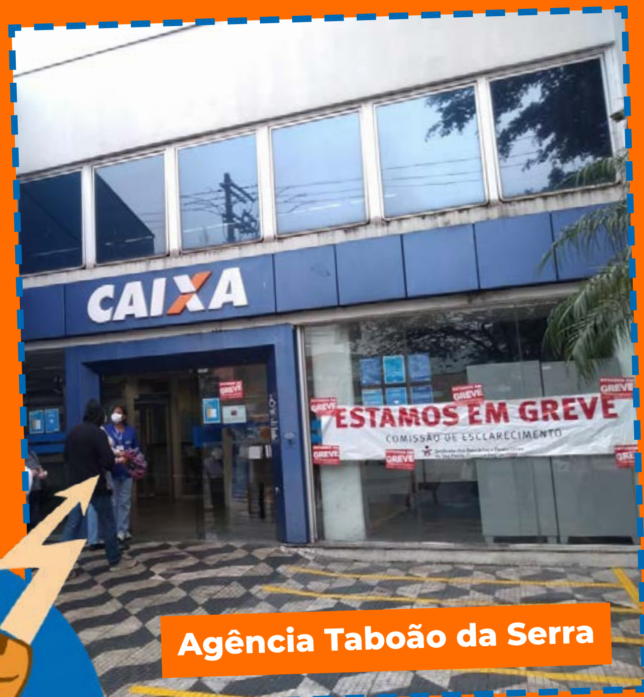
Agência Taboão da Serra