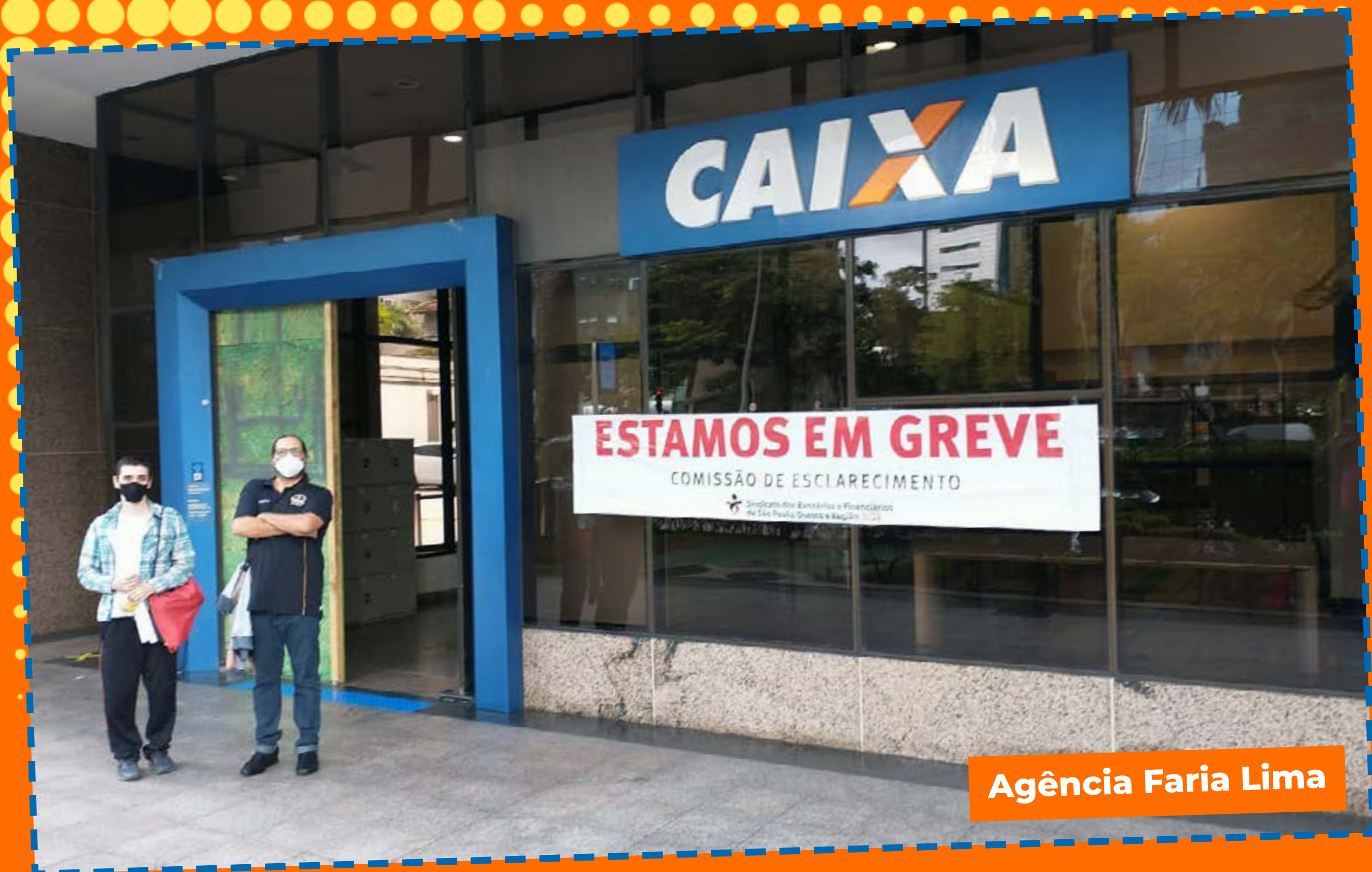
Agência Faria Lima