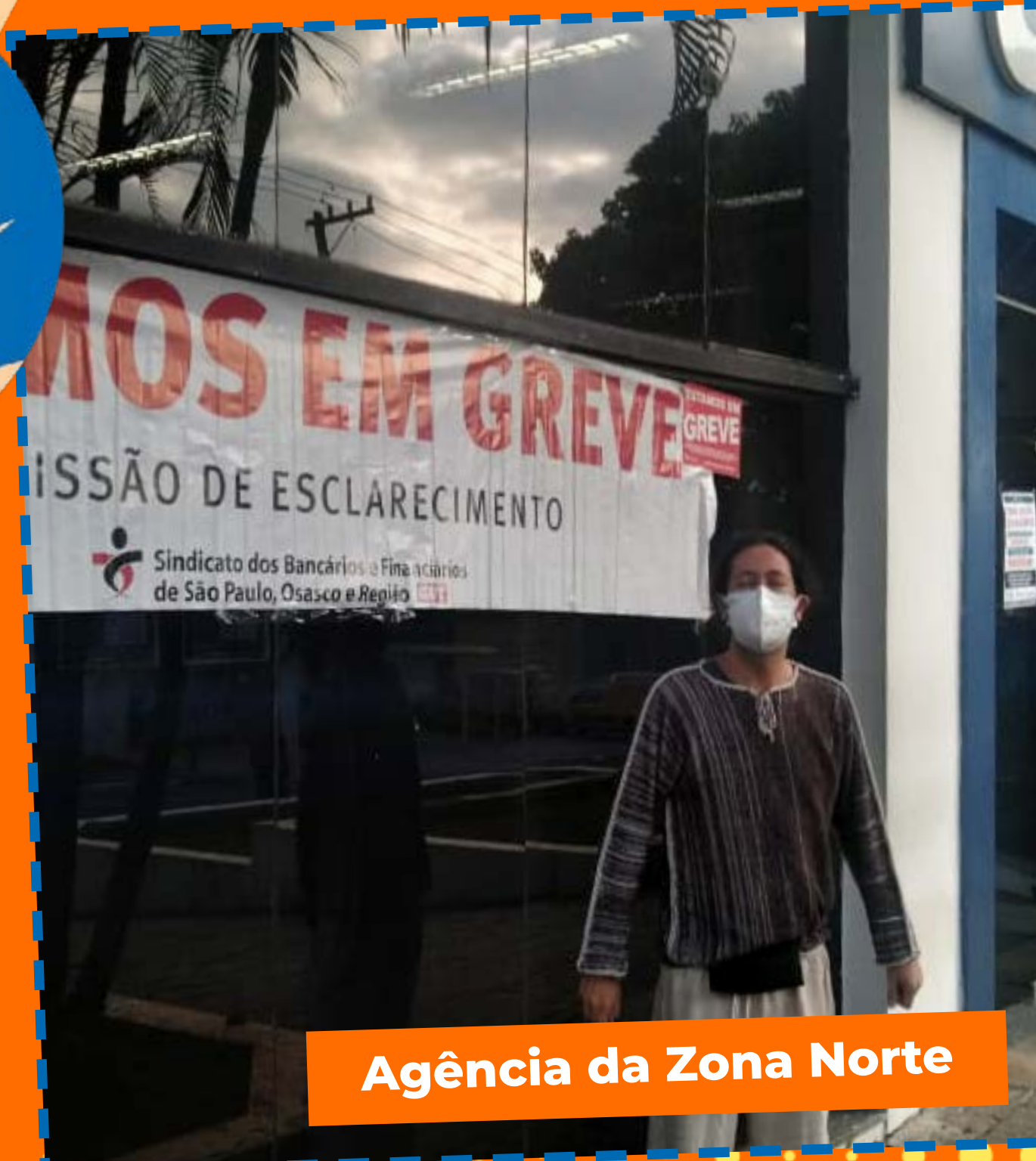
Agência da Zona Norte