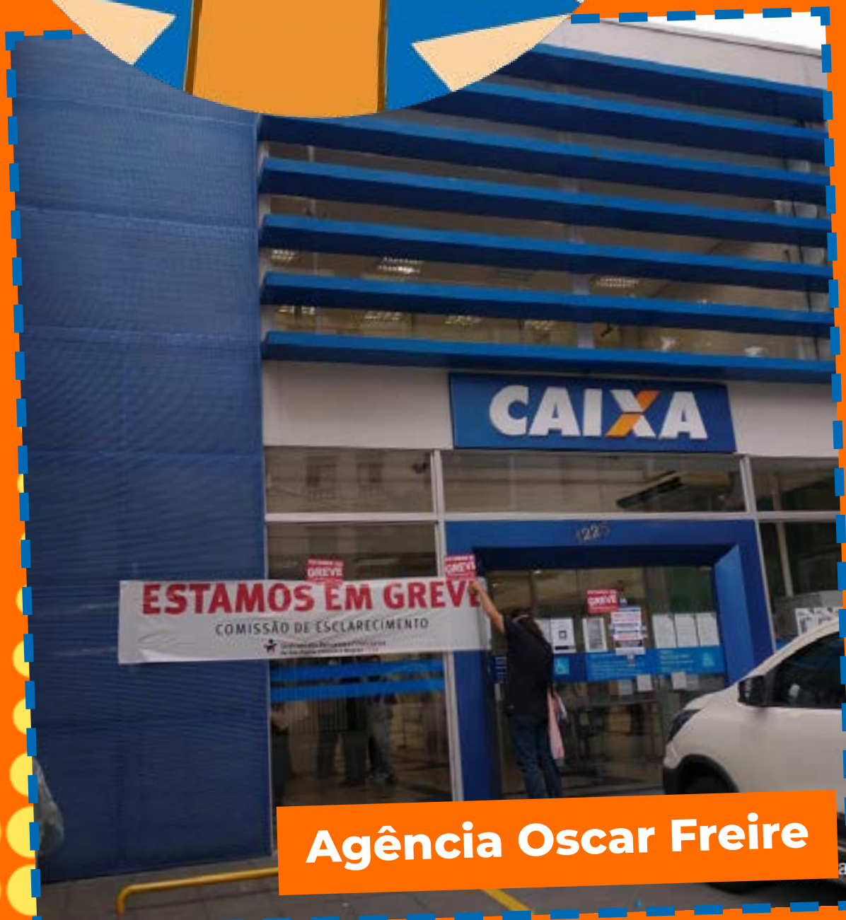
Agência Oscar Freire