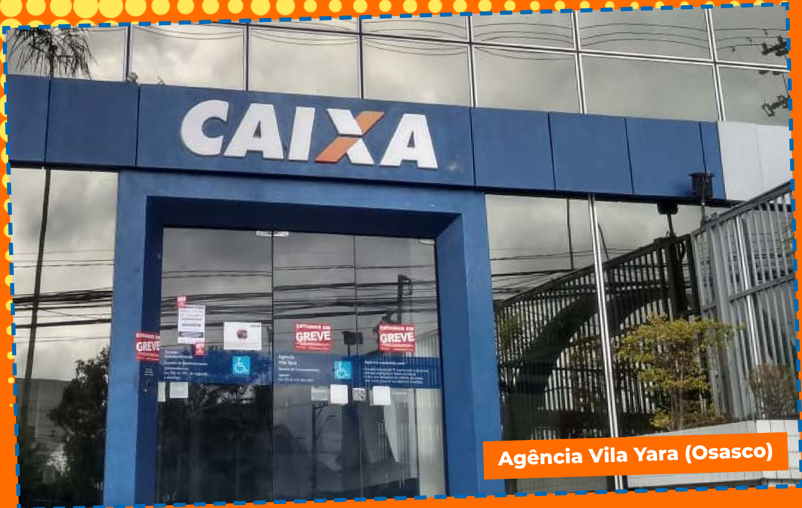
Agência Vila Yara (Osasco)