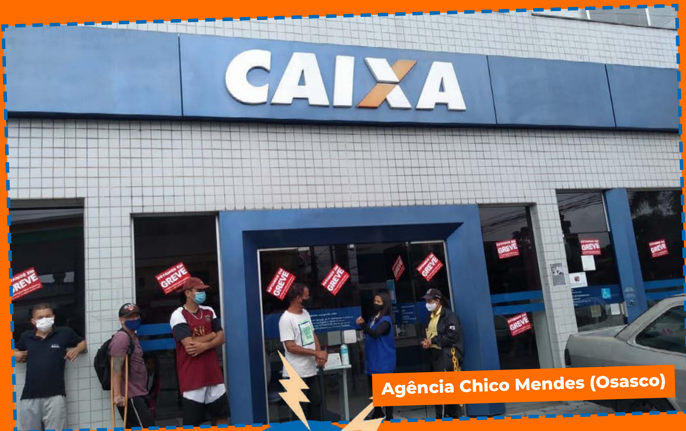
Agência Chico Mendes (Osasco)