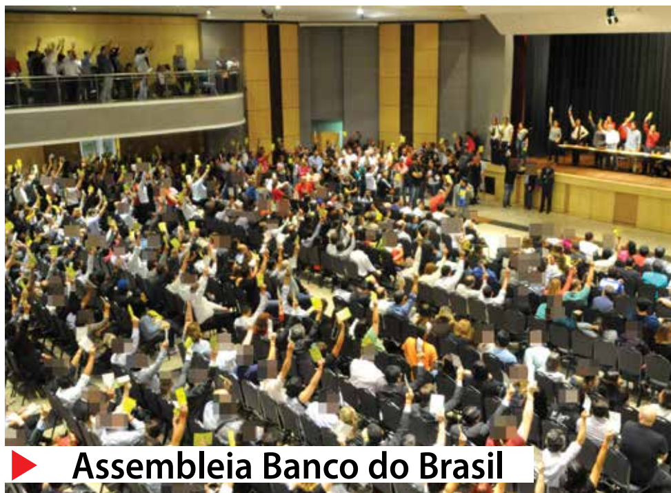
▶ Assembleia Banco do Brasil

Fenaban, e as específicas das instituições públicas, e encerraram, em 26 de outubro, a greve iniciada em 6 de outubro. As renovações da Convenção Coletiva de Trabalho (CCT) e os acordos aditivos específicos foram assinados em 3 de novembro.