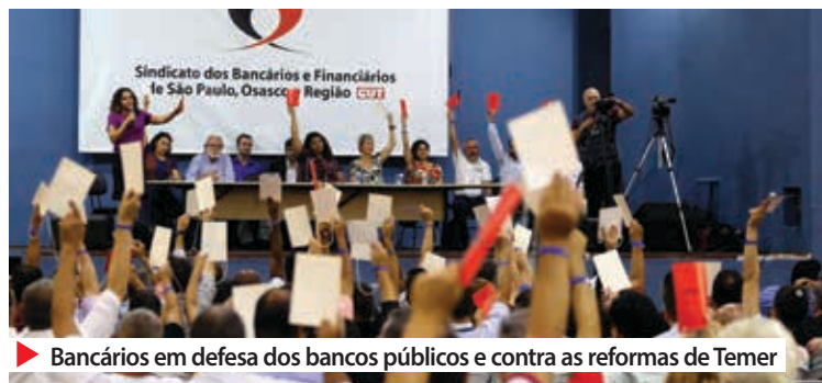
▶ Bancários em defesa dos bancos públicos e contra as reformas de Temer

prioridade do Sindicato. Temos realizado diversas manifestações para alertar a sociedade e envolver cada vez mais segmentos nessa luta”, diz a dirigente.