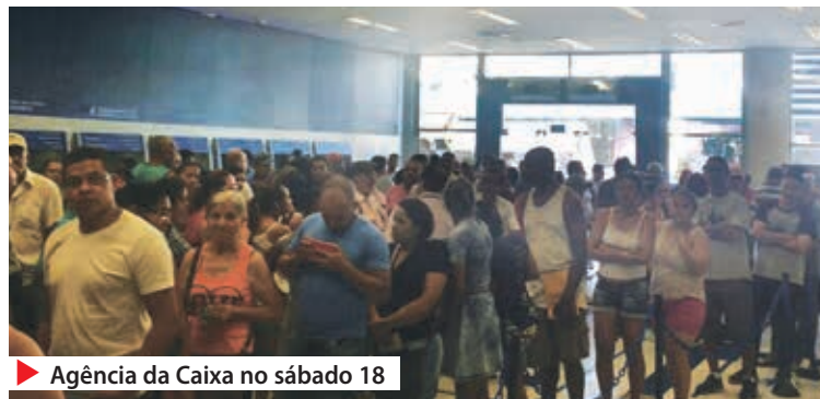
▶ Agência da Caixa no sábado 18

Os trabalhadores denunciaram que a situação piorou desde o anúncio do saque das contas