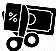
TABELA DE IMPOSTO DE RENDA DEFASADA CORRÓI PLR E REAJUSTE DOS BANCÁRIOS

Apesar de agora prometer na sua campanha eleitoral que o fará, da mesma forma como aconteceu em 2018, em nenhum ano do seu mandato Jair Bolsonaro reajustou a tabela de imposto de renda. No seu mandato, a defasagem já chega a 31,3%.