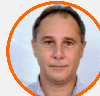
Plano Itaubanco CD - Ativos

Formado em RH e pós graduado em Gestão Pública, ingressou no banco em dezembro de 2003, exerce a função de analista e é lotado no Prédio do Aço. É diretor do Sindicato dos Bancários de São Paulo, Osasco e Região.