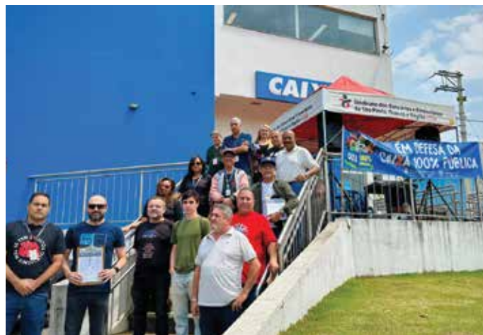
► Uma série de atividades do Sindicato marcou a luta pela manutenção da agência

A vitória contra o fechamento da agência Cipó-Guaçu é uma prova da força da luta coletiva. O Sindicato seguirá na luta contra o fechamento de agências, na defesa dos empregados e por uma Caixa 100% pública, com sua função social para o desenvolvimento do país cada vez mais fortalecida.