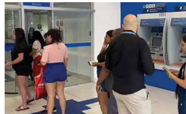
► Agência da Caixa em São Miguel Paulista foi mantida aberta após mobilização sindical contra o seu fechamento em 2024

O fechamento de agências e o aumento do número de clientes muito maior em relação ao de empregados resulta em sobrecarga de trabalho e adoecimentos nos bancários, e afasta o banco público da sua função social, ao dificultar o atendimento à população.