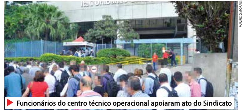
Funcionários do centro técnico operacional apoiaram ato do Sindicato

A paralisação contou com forte apoio dos funcionários, que aplaudiam a cada fala dos dirigentes sindicais denunciando a espiral de lucros astronômicos obtidos por meio da fórmula: demissões, sobrecarga de trabalho, aumento das