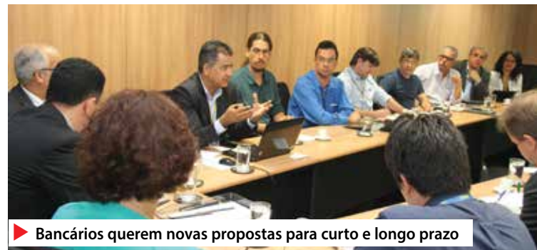
Bancários querem novas propostas para curto e longo prazo

Os funcionários propuseram cronograma de negociações mais intensivo e que sejam apresentadas novas propostas para serem discutidas, tanto no âmbito da sustentabilidade de longo prazo