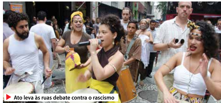
► Ato leva às ruas debate contra o racismo

Moreira, destacou o papel da entidade no combate à discriminação racial, criticando o grande número de casos de preconceito e intolerância noticiados nos últimos meses. “É inadmissível que alguém, em pleno 2015, seja discriminado pela cor da pele, pelo gênero, pela orientação sexual em nossa sociedade”, disse.