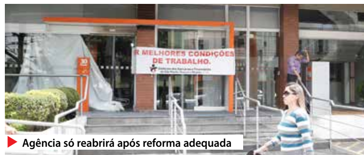
▶ Agência só reabrirá após reforma adequada

Entenda o caso – A agência da Aclimação teve os caixas in-