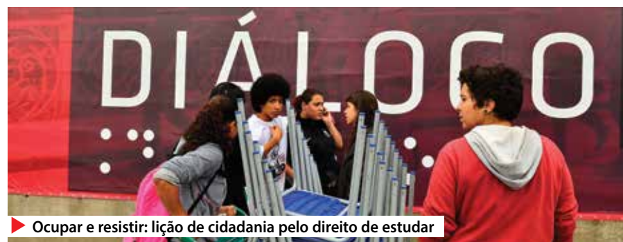
► Ocupar e resistir: lição de cidadania pelo direito de estudar