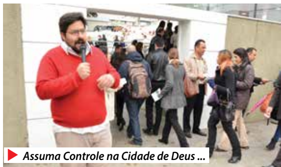
▶ Assuma Controle na Cidade de Deus ...

“Queremos que metas sejam construídas de forma coletiva, com os bancários sendo ouvidos sobre a melhor forma de atingir objetivos, sem assédio, adoecimento e com respeito às especificidades de cada local de trabalho”, afirma o secretário de Saúde e Condições de Tra-