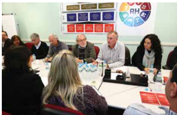
JALTON GARCIA / CONTRAF-CUT

Assista ao programa de webtv MB com a Presidenta sobre assunto no www.spbancarios.com.br/Videos.aspx?id=1285 .