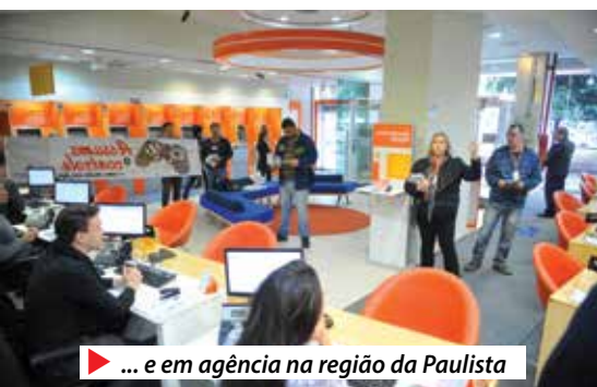
▶ ... e em agência na região da Paulista

Assista vídeo sobre a campanha no www.spbancarios.com.br/Videos.aspx?id=1249 .