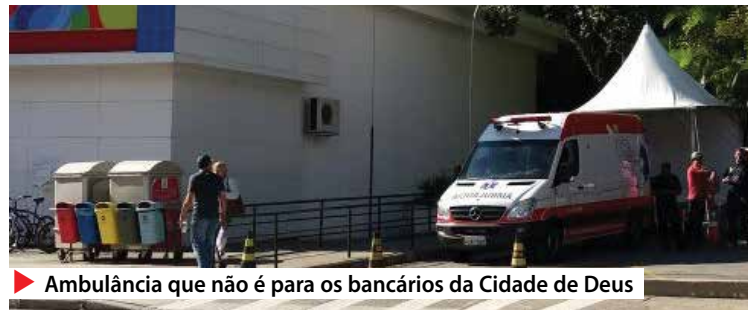
▶ Ambulância que não é para os bancários da Cidade de Deus