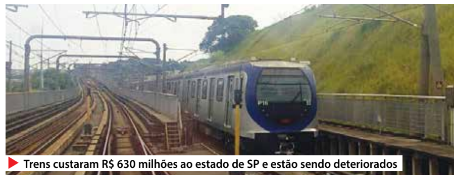
Trens custaram R$ 630 milhões ao estado de SP e estão sendo deteriorados