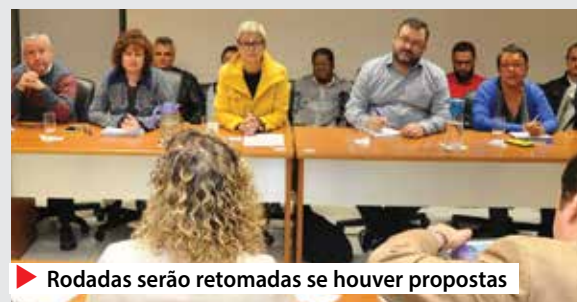
► Rodadas serão retomadas se houver propostas