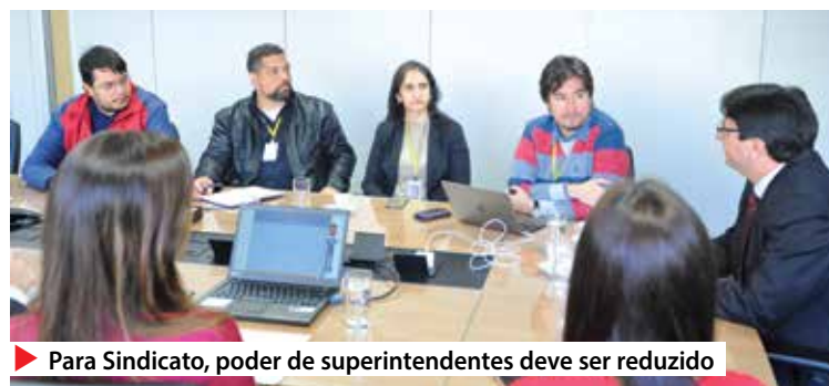
Para Sindicato, poder de superintendentes deve ser reduzido

Integrantes da Superintendência do BB de São Paulo apresentaram a dirigentes sindicais o programa Radar do Gestor, que avaliará o desempenho dos primeiros e segundos gestores, para ascensão ou descenso na carreira.