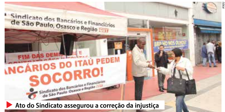
▶ Ato do Sindicato assegurou a correção da injustiça

“A primeira demissão e a demora do banco para con-