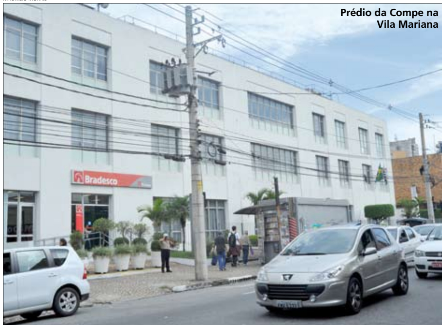
Prédio da Compe na Vila Mariana

O Bradesco procurou o Sindicato para informar o fim do departamento de compensação no prédio da Vila Mariana. A desativação foi provocada pela adoção da tecnologia de compensação por imagem, determinada por resolução do Banco Central no ano passado. A direção do Bradesco informou que os trabalhadores estão sendo realocados e não houve demissões.