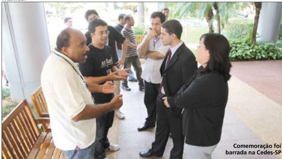
Comemoração foi barrada na Cedes-SP

A postura de alguns gestores impediu que os empregados da Caixa Federal do Cedes-SP, na zona sul de SP, comemorassem o aniversário de 89 anos do Sindicato.