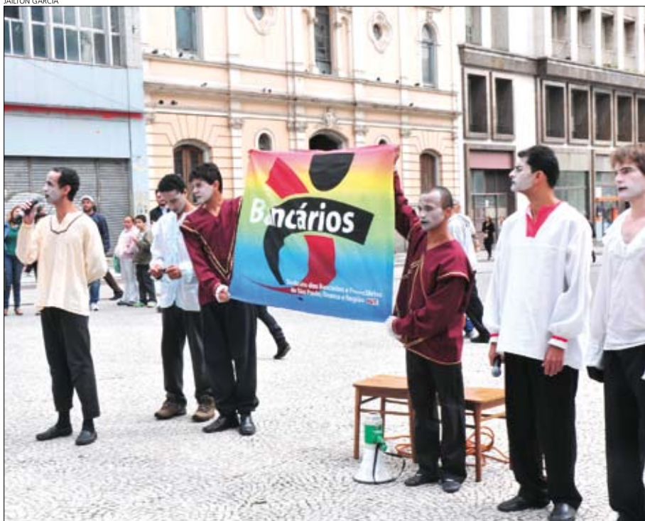
Ato de enfrentamento à homofobia cobra respeito às diferenças