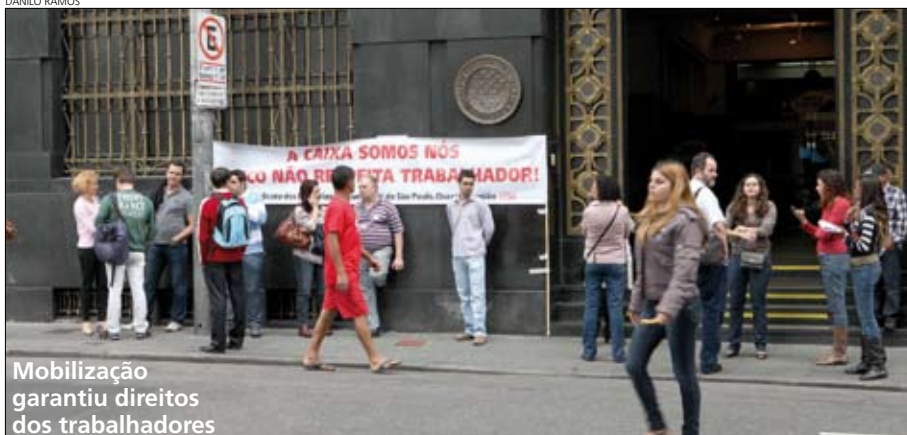
Mobilização garantiu direitos dos trabalhadores