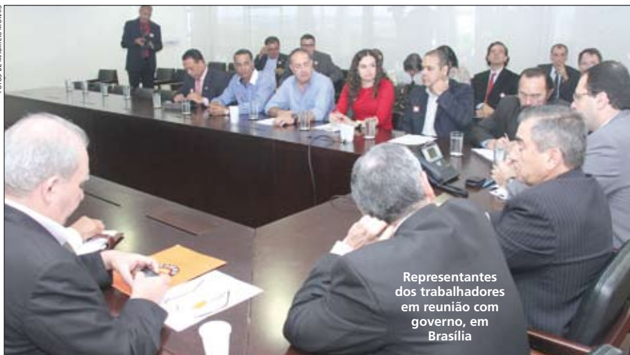
Representantes dos trabalhadores em reunião com governo, em Brasília

O governo apresentou às centrais sindicais sua proposta para isentar do pagamento de imposto de renda, parte da PLR recebida pelos trabalhadores. Em reunião no dia 31 de maio, o ministro da Secretaria-Geral da Presidência da República, Gilberto Carvalho, propôs desonerar da cobrança do IR valores de PLR de até R$ 5 mil anuais.