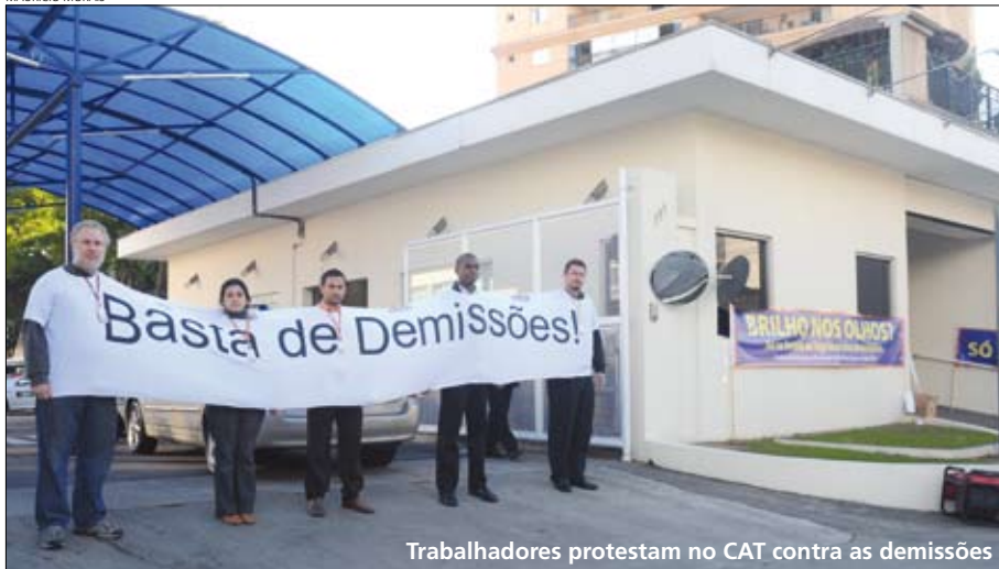
Trabalhadores protestam no CAT contra as demissões

Os bancários conseguiram fazer o Itaú breicar as demissões. O compromisso de “reduzir o turn over ” foi informado pela direção do banco em contato com o Sindicato no dia 19 de junho. Um comunicado foi enviado pelo comando da instituição financeira aos seus diretores, orientando que as dispensas devem ser freadas. O centro de realocação dos funcionários – conquistado pelo movimento sindical após a fusão com o Unibanco – também deve ser valorizado, já que a direção do Itaú informou que vai dificultar novas contratações.