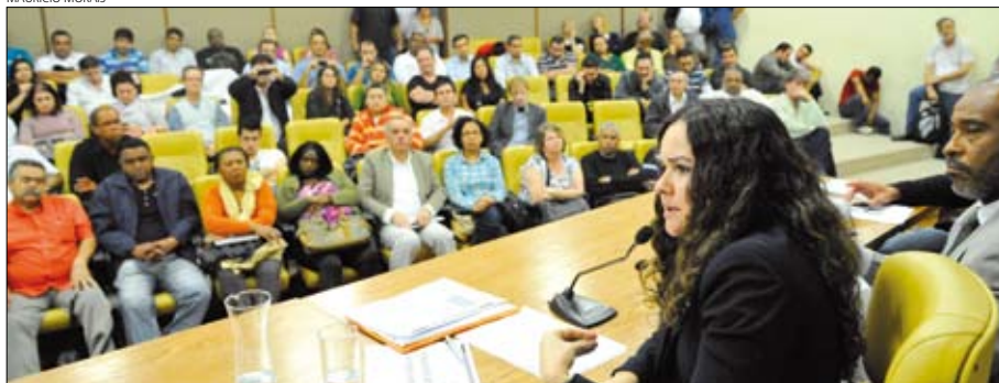
Presidenta Juvandia Moreira fala durante audiência pública na Câmara Municipal