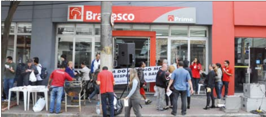
Ato denunciou assédio moral em agência na zona leste