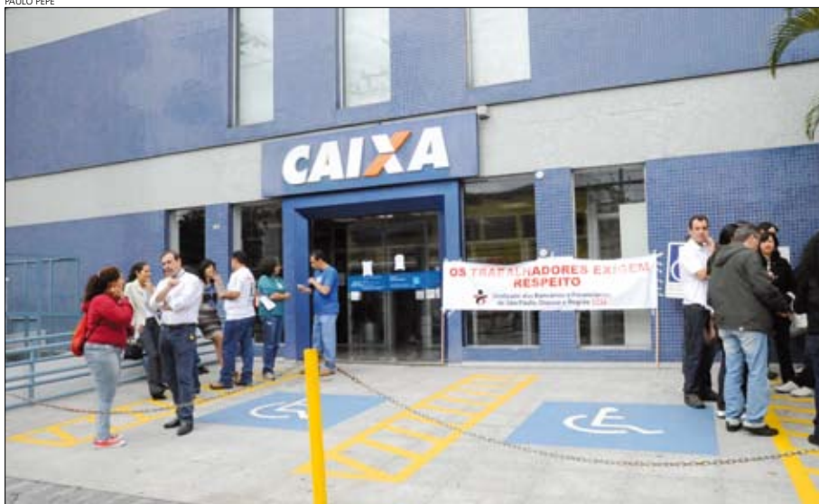
Protesto do Sindicato contra trabalho dos empregados aos sábados