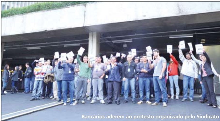
Bancários aderem ao protesto organizado pelo Sindicato

O s funcionários da Central de Atendimento do Banco do Brasil (CABB) paralisaram as atividades por cerca de duas horas no período da manhã e mais duas horas no turno da tarde no dia 12 de junho. A motivação do protesto se deu por causa da falta de resposta sobre uma série de reivindicações.