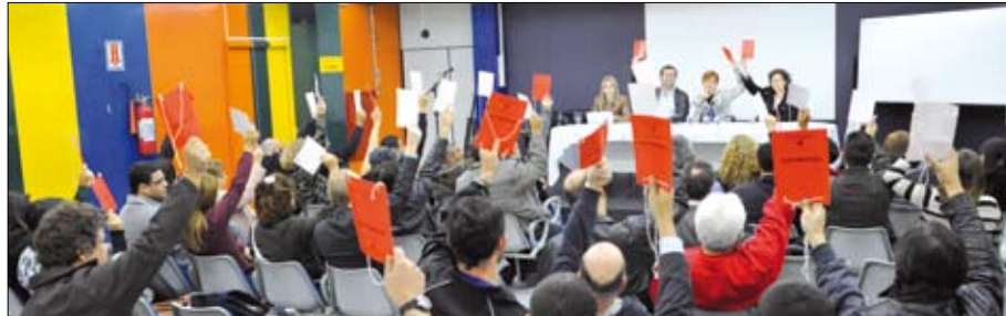
Assembleia realizada na sede do Sindicato aprova acordo aditivo

O envolvimento dos trabalhadores nas manifestações ao longo dos anos e a firmeza dos dirigentes sindicais nas negociações fizeram a diferença para que o Santander Brasil apresentasse proposta para a renovação do acordo aditivo à Convenção Coletiva de Trabalho.