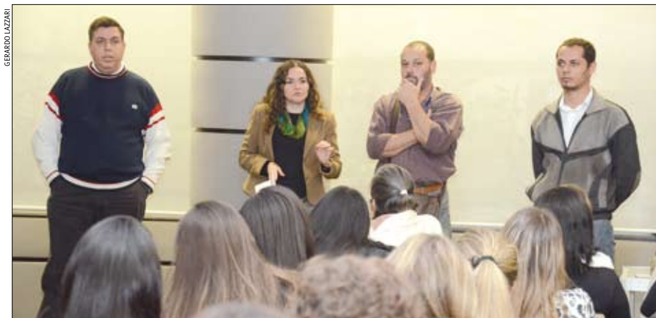
Presidenta Juvandia Moreira fala com os trabalhadores do Cruzeiro do Sul