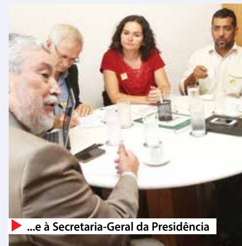
▶ ...e à Secretaria-Geral da Presidência

Leia mais em www.spbancarios.com.br/Noticias.aspx?id=3927 .