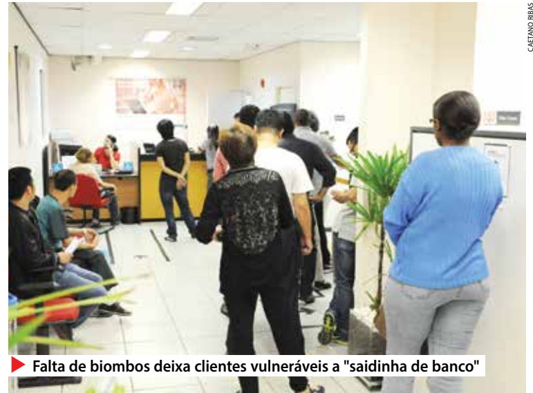
▶ Falta de biombos deixa clientes vulneráveis a "saidinha de banco"

LEIA MAIS www.spbancarios.com.br/Noticias.aspx?id=3229