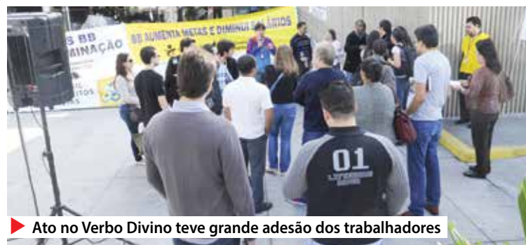
▶ Ato no Verbo Divino teve grande adesão dos trabalhadores

No Verbo Divino os funcionários contam que o gerente-geral da Central de Atendimento selecionou grupos com bancários que apresentaram deficiências