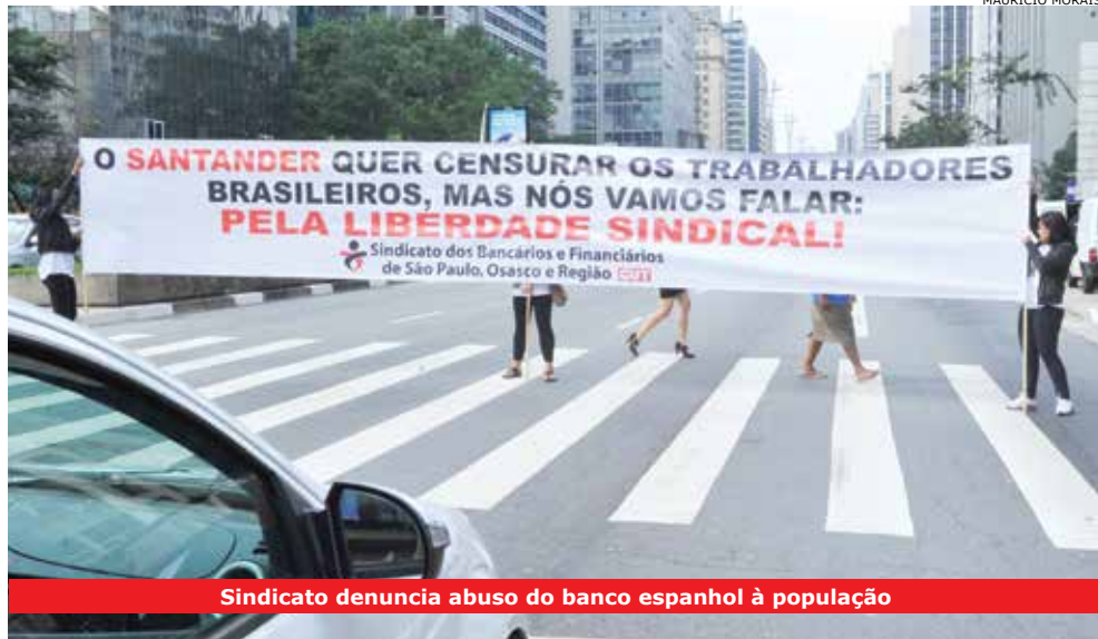
Sindicato denuncia abuso do banco espanhol à população

A postura da direção do Santander de cercear a organização sindical e a liberdade de expressão dos trabalhadores motivaram três dias consecutivos de protestos nas ruas, agências e concentrações do banco. Os atos ocorreram em 22, 23 e 24 de maio, sendo que a data de 23 teve caráter de Dia Internacional de Repúdio às Práticas Antissindicais do Santander no Brasil.