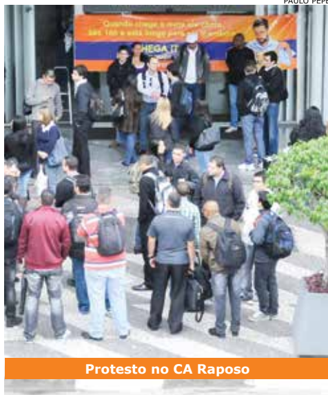
Protesto no CA Raposo