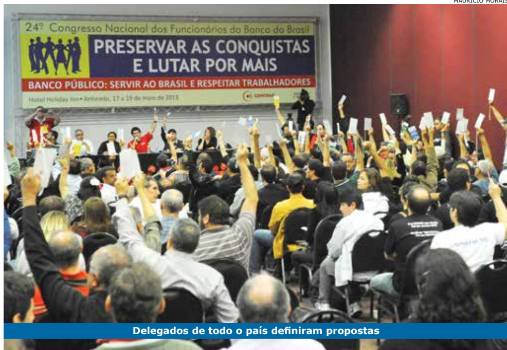
Delegados de todo o país definiram propostas