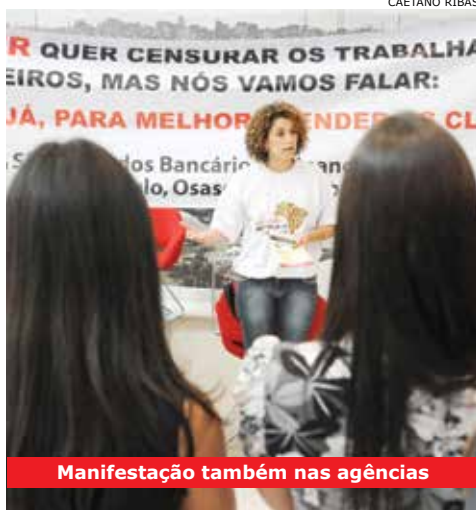
Manifestação também nas agências