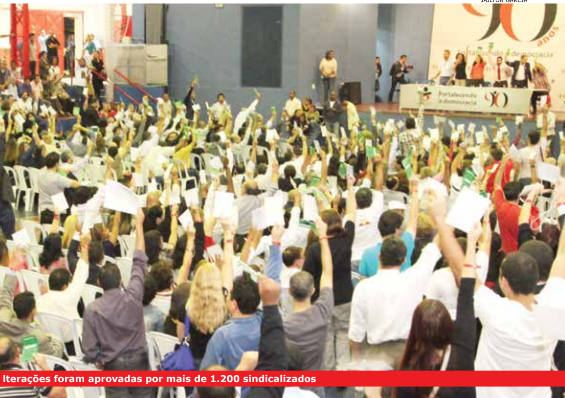
Iterações foram aprovadas por mais de 1.200 sindicalizados

locais de trabalho, e essa organização deve ser ampliada ainda mais com as mudanças aprovadas nessa grande assembleia”, afirma. “Nossa trajetória é de democracia, de respeito. Temos compromisso com os trabalhadores e, por isso, eles compareceram à assembleia para ouvir e votar. No nosso Sindicato, as grandes decisões são tomadas por quem de direito: os bancários. A mudança do estatuto é mais uma delas e entra para a história da organização bancária.”