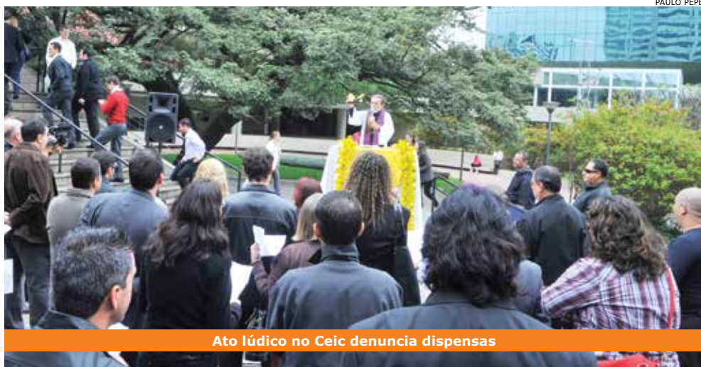
Ato lúdico no Ceic denuncia dispensas

O fim das demissões foi uma das principais exigências de dirigentes sindicais feitas à direção do Itaú durante entrega da pauta dos trabalhadores da empresa, em 15 de maio.