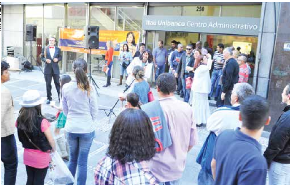
Ato lúdico no Centro chama atenção para situação dos bancários

Quebrar o silêncio do Itaú em relação às reivindicações dos trabalhadores. Com esse objetivo, o Sindicato ampliou as manifestações da campanha de valorização dos funcionários que, neste ano, tem como tema Esse Cara Sou Eu . Feita a partir de paródia da música de Roberto Carlos, composta por criativo bancário, a campanha relata problemas vivenciados pelos funcionários diariamente. A pauta foi entregue ao banco no final de maio, mas até o fechamento desta edição não havia negociação marcada.