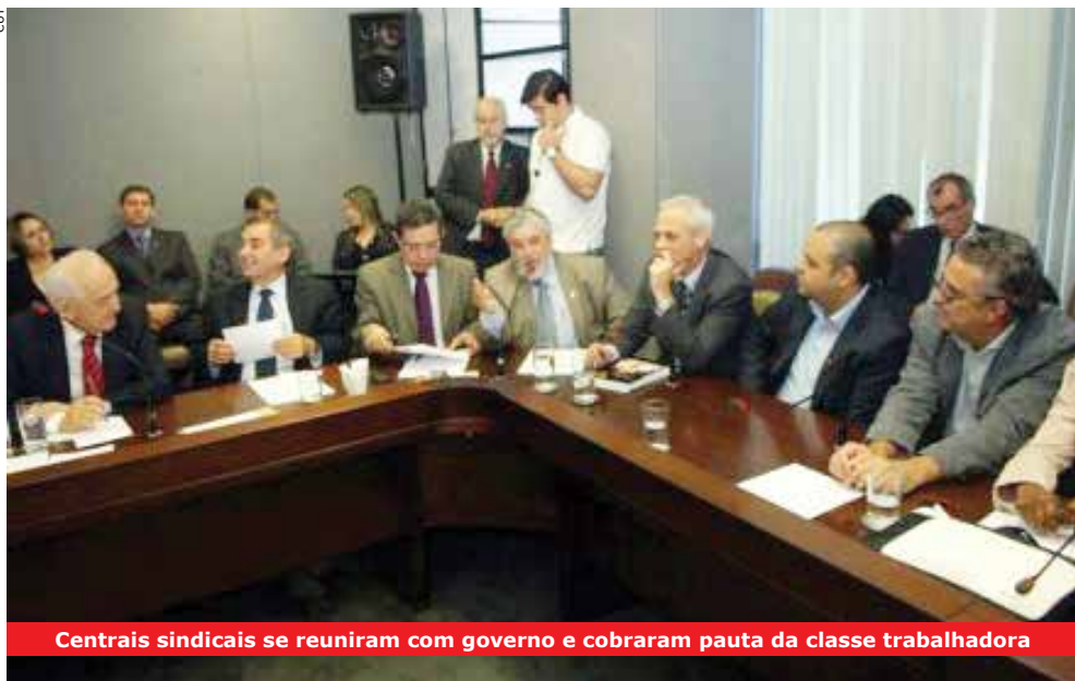
Centrais sindicais se reuniram com governo e cobraram pauta da classe trabalhadora