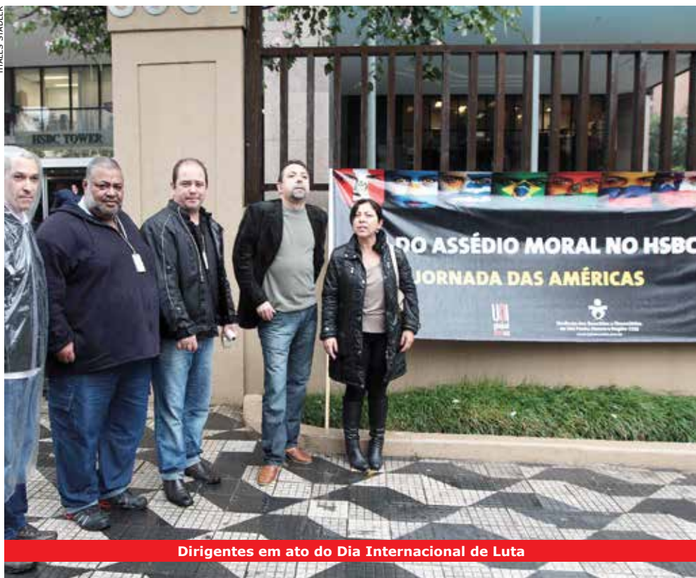
Dirigentes em ato do Dia Internacional de Luta