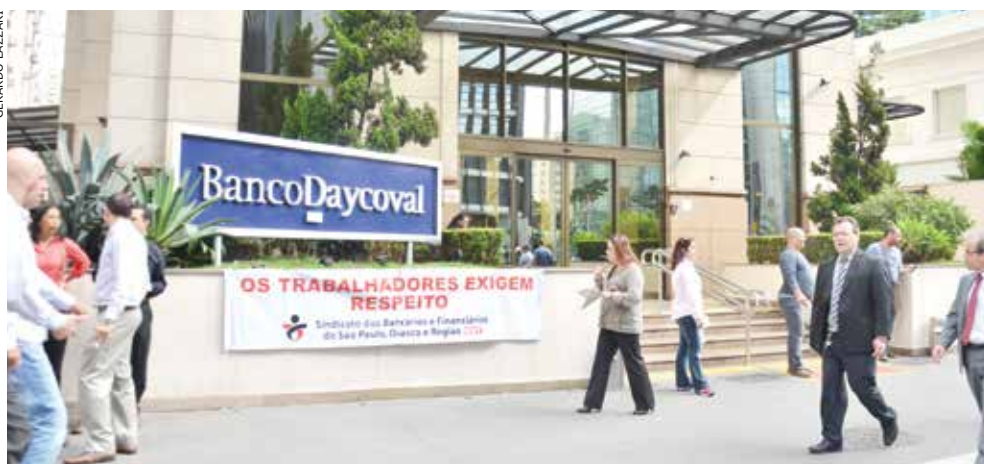
Manifestação na Paulista denunciou dispensa de funcionário