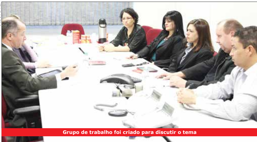
Grupo de trabalho foi criado para discutir o tema

A Comissão de Organização dos Empregados tem discutido com representantes do banco as reivindicações da campanha nacional de valorização dos funcionários que neste ano tem como tema Bancário não é de lata é gente como você, gente de verdade! – alusão ao Homem de Lata, personagem do Mágico de Oz que queria ter um coração e ser visto como ser humano.