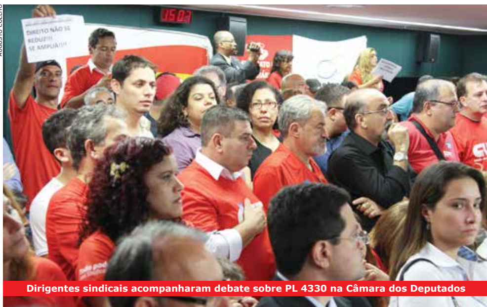
Dirigentes sindicais acompanham debate sobre PL 4330 na Câmara dos Deputados

Entre os danos aos trabalhadores, caso o PL 4330 seja aprovado, está a terceirização até mesmo de atividade fim, além de não prever a responsabilidade solidária da contratante em caso de desrespeito aos direitos dos funcionários. O PL também não atende reivindicações fundamentais dos trabalhadores: igualdade de tratamento entre terceirizados e os contratados diretamente, e que o acordo coletivo dos terceirizados seja o do sindicato predominante.