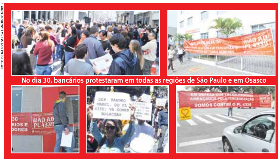
No dia 30, bancários protestaram em todas as regiões de São Paulo e em Osasco

TST – Em uma iniciativa histórica, 19 dos 27 ministros do TST, instância máxima da Justiça Trabalhista, enviaram carta à CCJ afirmando que ao ampliar a terceirização, o PL 4330 causará grande prejuízo aos direitos sociais, trabalhistas e previdenciários no país. Leia carta na íntegra no www.spbancarios.com.br/Noticias.aspx?id=5635 .