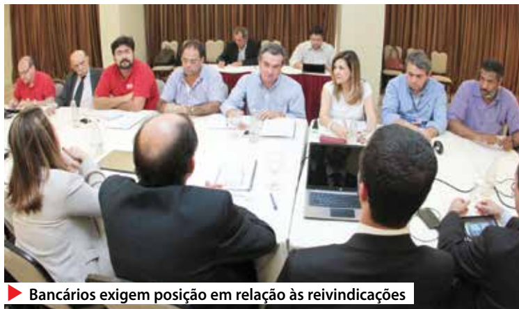
▶ Bancários exigem posição em relação às reivindicações

“A federação dos bancos apresentou proposta ao Comando Nacional dos Bancários para as questões gerais da categoria. Agora reivindicamos que a Caixa também se posicione em relação aos diversos temas debatidos”, afirma o integrante da