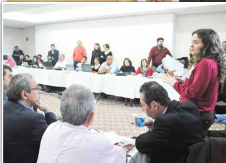
Fenaban apresentou proposta de 6,1%. Comando rejeitou e definiu calendário de luta (foto ao lado)

30% da remuneração líquida. De acordo com o proposto, os bancários não terão mais de devolver esse adiantamento.