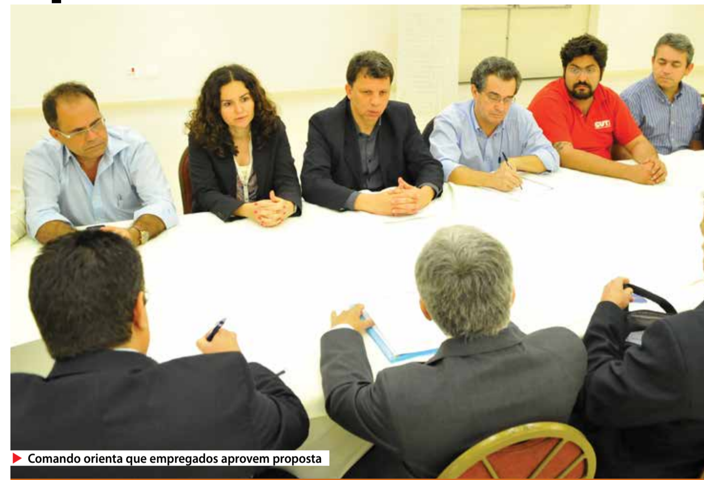
Comando orienta que empregados aprovelem proposta

COMISSÕES PARITÁRIAS – A Caixa sinalizou que pretende abrir o diálogo sobre temas cruciais para os empregados. O banco propôs a criação de duas comissões paritárias. Uma para discutir as condições de trabalho, que debateria o número de empregados por unidade, o assédio moral, as metas e outras questões