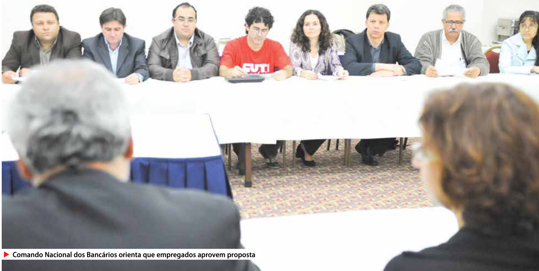
Comando Nacional dos Bancários orienta que empregados aprovelem proposta