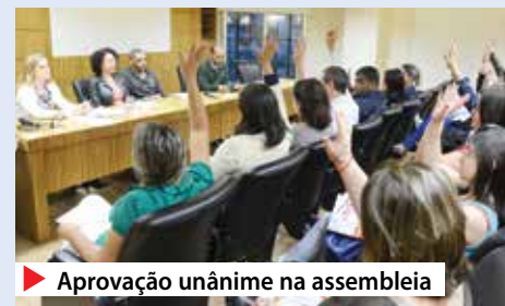
Aprovação unânime na assembleia

A assinatura do acordo está prevista para