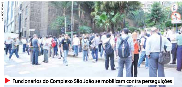
▶ Funcionários do Complexo São João se mobilizam contra perseguições

As manifestações são resposta à retaliação da direção da instituição financeira contra os funcionários que aderiram à greve da categoria. Entre as medidas do banco, está a imposição para que os bancários assinem termos pessoais sobre compensação dos dias da greve, mas pelo previsto na Convenção Coletiva de Tra-