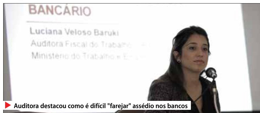
Auditora destacou como é difícil "farejar" assédio nos bancos

LEIA MAIS www.spbancarios.com.br/Noticias.aspx?id=6081