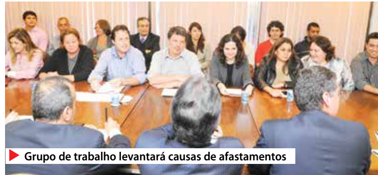
▶ Grupo de trabalho levantará causas de afastamentos