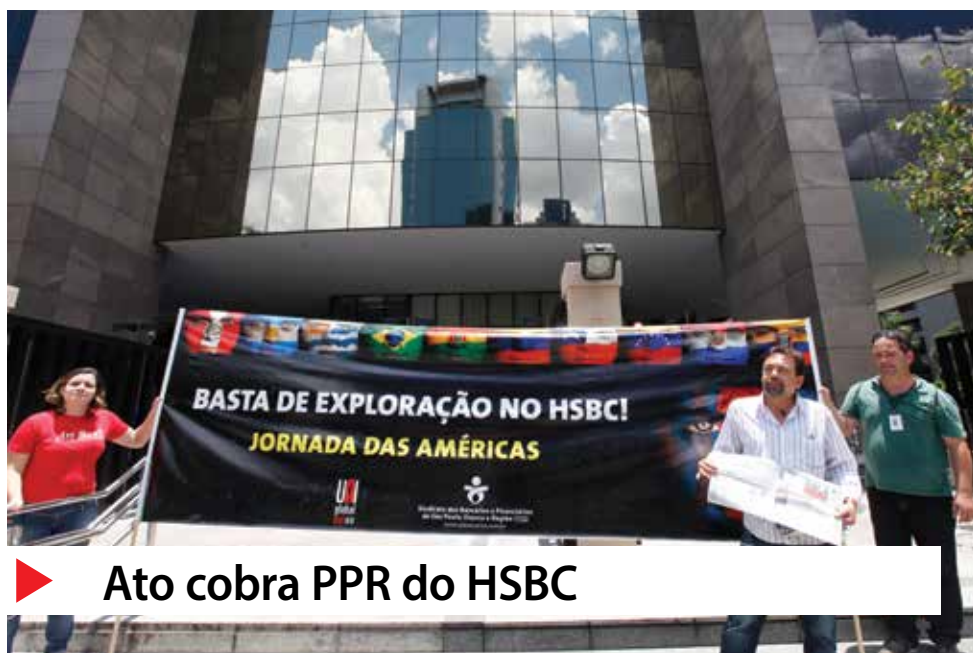
▶ Ato cobra PPR do HSBC

A ação pede a devolução do valor de PPR que foi descontado na PLR da Convenção Coletiva de Trabalho da categoria, desde 2007. Solicita ainda