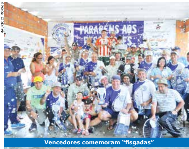
Vencedores comemoram "fígadas"

SORTEIO – Ao final da competição foram sorteados brindes como viagens para Natal e Florianópolis, por meio da parceria mantida entre o Sindicato e a Reprotel, e também para Ubatuba, com hospedagem no Chalés Estrela do Mar.