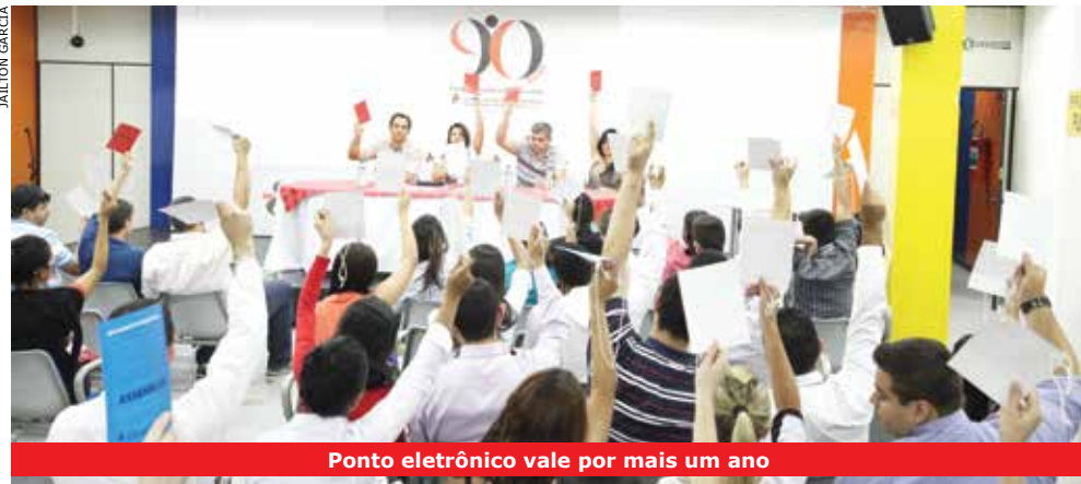
Ponto eletrônico vale por mais um ano

Os funcionários do Bradesco realizaram duas assembleias distintas para deliberar sobre proposta de renovações de acordos específicos: um dos trabalhadores do Telebanco e outro para o sistema alternativo de ponto eletrônico. Ambos foram aprovados em 17 de dezembro.