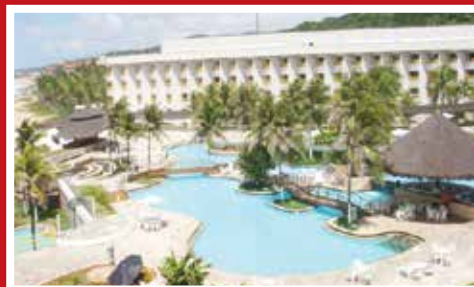
PIRÂMIDE PALACE HOTEL Natal - RN

POUSADA PORTAL DAS CEREJEIRAS Rua Alcídio Vitorino, 40, Vila Lolly, Campos do Jordão ☎ (12) 3364-4730 ☎ (12) 3664-6468 www.pousadaportalascerejeiras.com.br