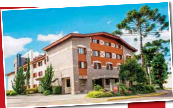
HOTEL ALPENHAUS Gramado - RS

Desconto: 15% a vista ou a prazo em toda a rede de hotéis, parcelado em até 4 vezes sem juros