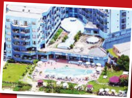
INGLESSES PRAIA HOTEL Florianópolis - SC