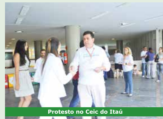
Protesto no Ceic do Itaú

MAIS PROTESTO - O Sindicato também paralisou atividades de agências em dezembro devido à falta de trabalhadores para dar conta da demanda. Uma das unidades em que a entidade protestou foi a Quarta Parada, onde os funcionários têm de se desdobrar para atender ao grande número de clientes e a população.