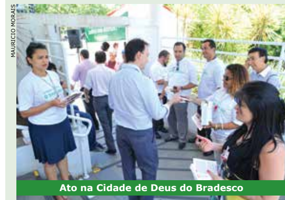
Ato na Cidade de Deus do Bradesco

Em resposta à postura do Bradesco e do Itaú de quererem acabar com a Sipat (Semana Interna de Prevenção de Acidentes), o Sindicato protestou em duas das principais concentrações desses bancos: Cidade de Deus e Ceic (Centro Empresarial Itaú Conceição) nos dias 5 e 6 de dezembro, respectivamente.