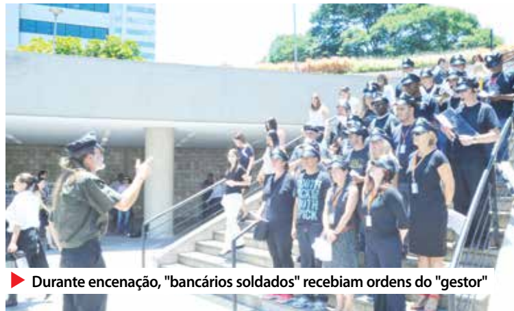
▶ Durante encenação, "bancários soldados" recebiam ordens do "gestor"

"É absurda a utilização de palavras como 'extermínio' e a referência à violência para dar motivação aos trabalhadores. O que deixará o bancário do Itaú motivado é melhor