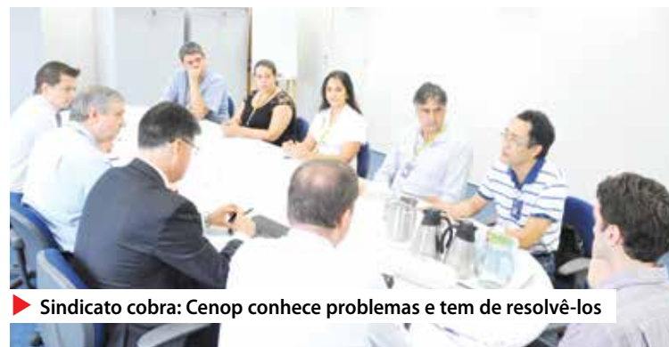
▶ Sindicato cobra: Cenop conhece problemas e tem de resolvê-los

Depois de diversos atos e paralisações em protesto contra a falta de ar-condicionado e más condições de trabalho, dirigentes do Sindicato e representantes do Banco do Brasil reuniram-se na terça 28. Os trabalhadores cobraram soluções para os problemas de várias unidades.