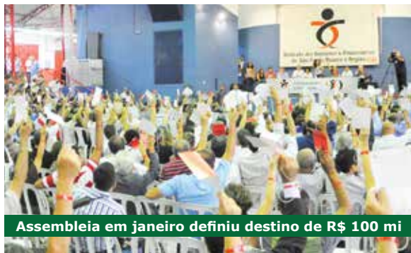
Assembleia em janeiro definiu destino de R$ 100 mi

Os funcionários também deliberaram pela reivindicação, junto ao Ministério Público (MP) e ao desembargador do Tribunal de Justiça, para que o valor seja reconhecido como de natureza indenizatória. Dessa forma, não haveria incidência de imposto de renda.