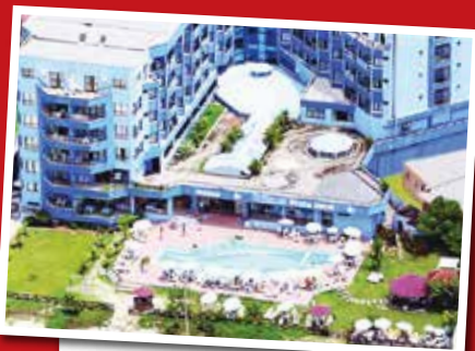
INGLESES PRAIA HOTEL Florianópolis - SC