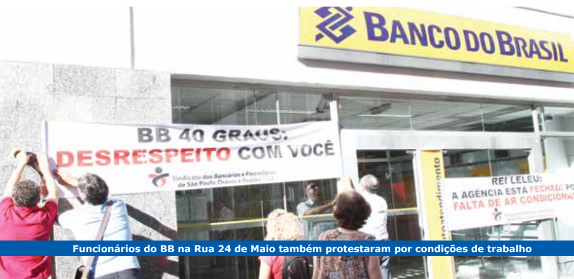
Funcionários do BB na Rua 24 de Maio também protestaram por condições de trabalho