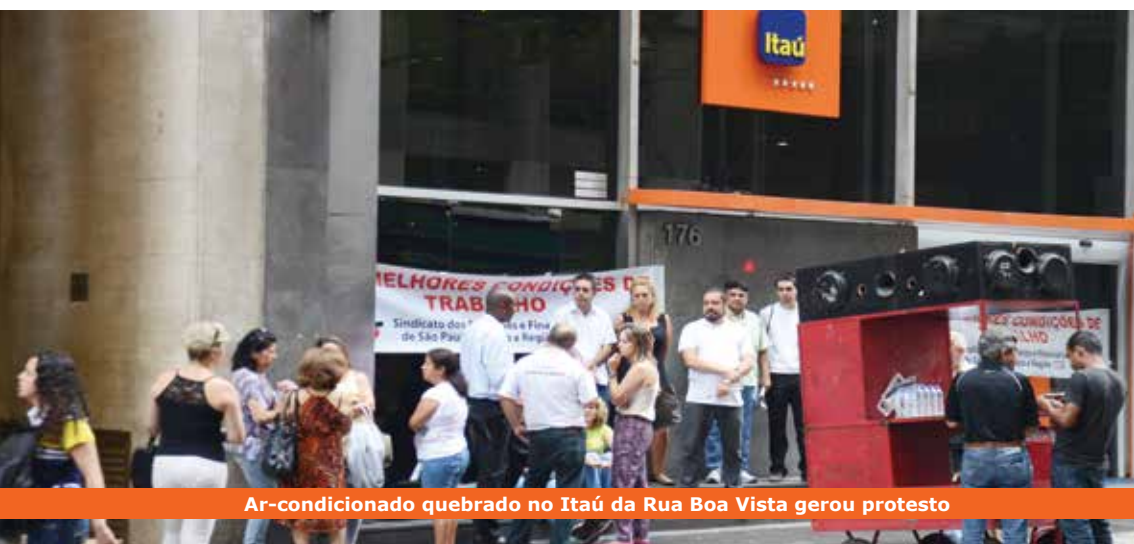
Ar-condicionado quebrado no Itaú da Rua Boa Vista gerou protesto