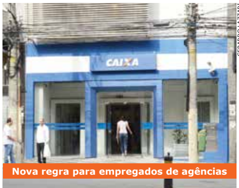
Nova regra para empregados de agências

A Caixa, de janeiro a setembro de 2013, expandiu a rede de atendimento com a abertura de 332 novas agências e PABs. Foram contratados mais 7.015 em 12 meses. No entanto, Dionísio