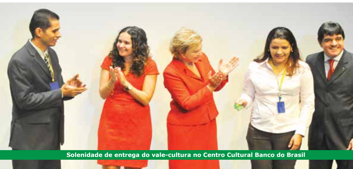
Solenidade de entrega do vale-cultura no Centro Cultural Banco do Brasil