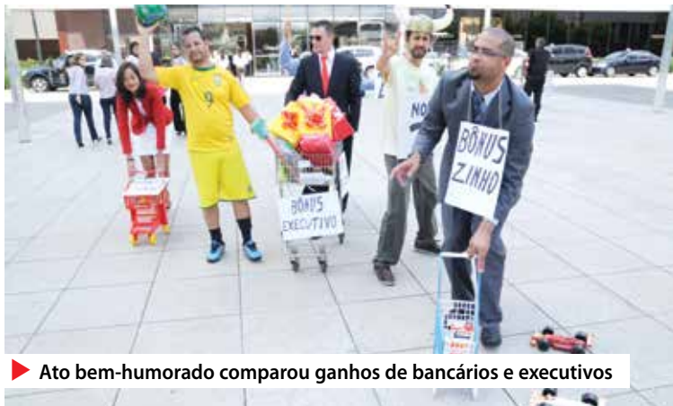
▶ Ato bem-humorado comparou ganhos de bancários e executivos

O Santander possui um sistema de avaliação individual do funcionário baseado em uma série de planos de metas. Com base no desempenho nesses programas, além da avaliação pessoal, calcula-se uma nota linear entre 0 e 5, onde 3 é a “nota de corte”. Se for classificado com menos que