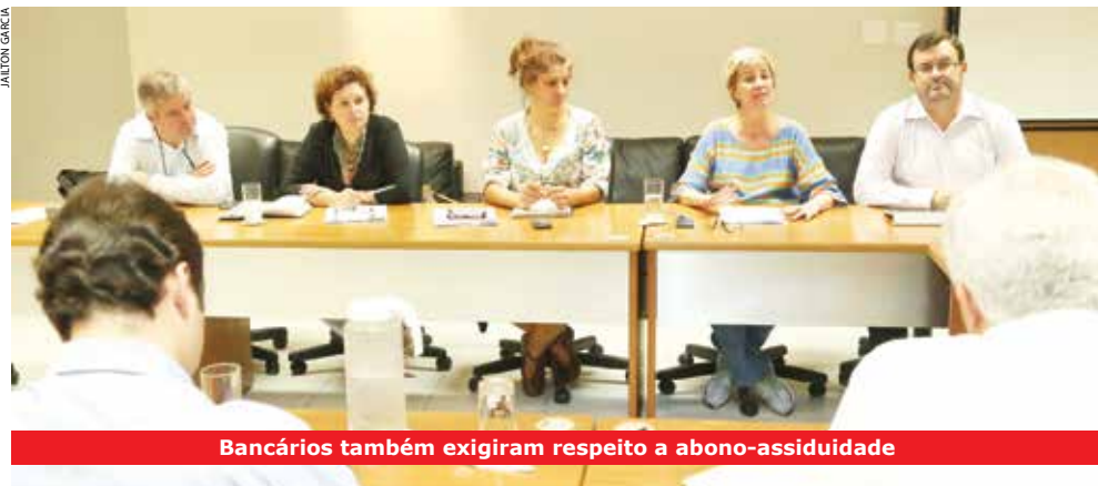
Bancários também exigiram respeito a abono-assiduidade

Os representantes dos trabalhadores e do Santander retomaram as discussões sobre questões que afetam funcionários de agências, departamentos e de call center. A reunião ocorreu em 12 de março, no Sindicato.