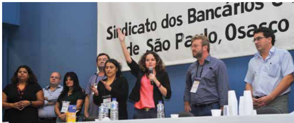
Juvandia: "Categoria referendou gestão da diretoria do Sindicato"

Bancários dão show de democracia, comparecem em grande número às urnas e mostram porque são uma das mais fortes e organizadas categorias do país