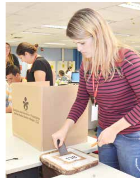
Bancários votam no HSBC Casp