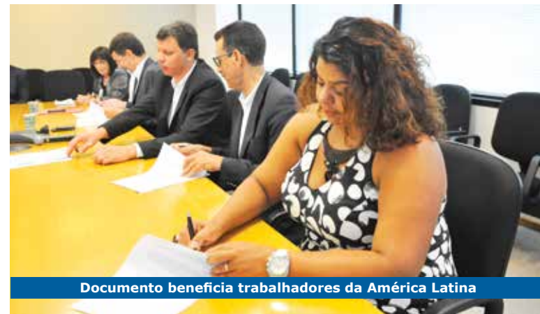
Documento beneficia trabalhadores da América Latina

O acordo foi assinado pelos representantes do Itaú, pela UNI Global Union – que representa 20 milhões de trabalhadores no mundo –, pelo Sindicato e demais entidades de bancários dos países envolvidos, pelas confede-