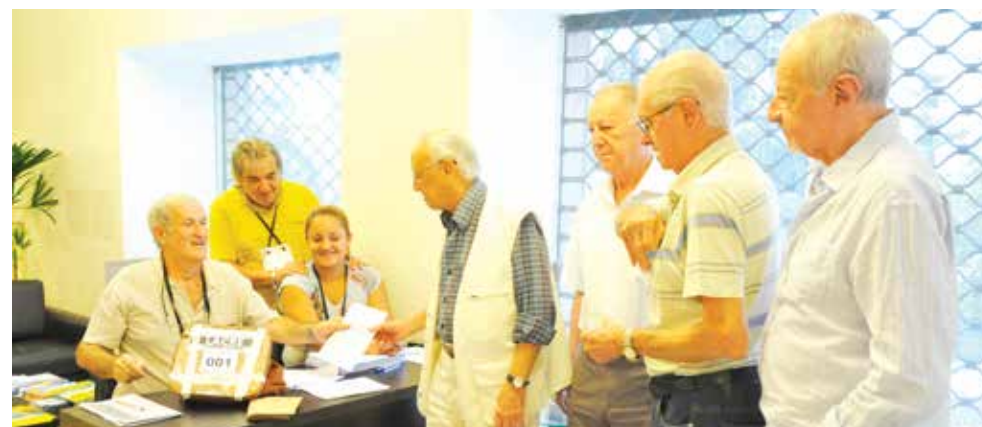
Aposentados participaram em peso da eleição depositando seus votos na urna que ficou na sede do Sindicato

SÃO PAULO A SALVADOR – Para permitir que todos os trabalhadores exercessem seu direito democrático de participar da eleição do Sindicato, foram percorridos milhares de quilômetros durante os quatro dias de votação. Se consideradas apenas as idas e voltas de uma urna entre São Paulo e as cidades de Carapicuíba, São Lourenço da Serra,