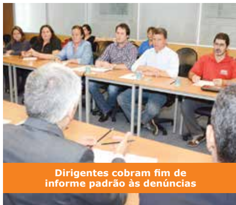
Dirigentes cobram fim de informe padrão às denúncias