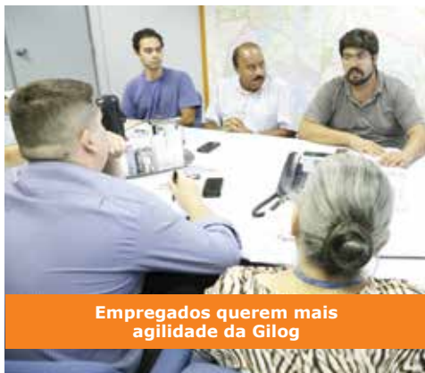
Empregados querem mais agilidade da Gilog

Em outras unidades que constam da lista encaminhada pelo Sindicato,