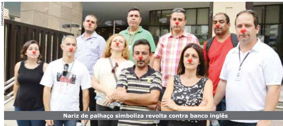
Nariz de palhaço simboliza revolta contra banco inglês

O Sindicato protestou em frente ao Tower do HSBC contra o não pagamento da segunda parcela da PLR (Participação nos Lucros e Resultados) pelo banco inglês. A manifestação ocorreu em 11 de março.