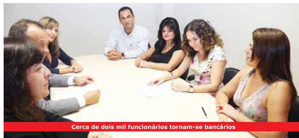
Cerca de dois mil funcionários tornam-se bancários

Os cerca de dois mil trabalhadores da Bradesco Financiamentos da base de São Paulo, Osasco e região que estavam enquadrados como comerciários, agora são bancários. Foi assinado em 12 de março, pelo Sindicato e pelo banco, o acordo que garante a esses funcionários os direitos da Convenção Coletiva de Trabalho da categoria. O acordo começa a valer em abril.