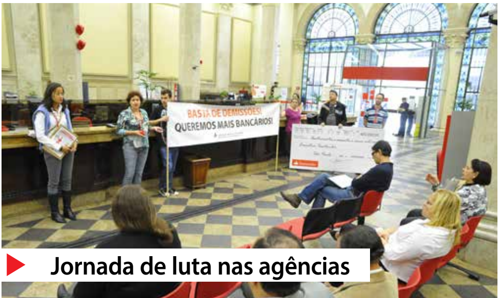
▶ Jornada de luta nas agências