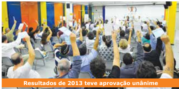
Resultados de 2013 teve aprovação unânime

O balanço patrimonial do exercício 2013 do Sindicato foi aprovado por unanimidade pelos bancários sindicalizados. A decisão ocorreu em assembleia realizada na sede da entidade em 24 de junho.