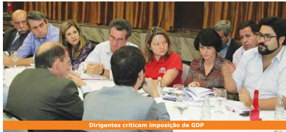
Dirigentes criticam imposição de GDP

Os gerentes-gerais da Caixa integram o primeiro ciclo de trabalhadores atingidos pela nova medida da direção do banco para aumentar a cobrança por venda de produtos: a Gestão de Desempenho de Pessoas (GDP). Política imposta de forma unilateral e que estará entre as pautas da Campanha 2014.