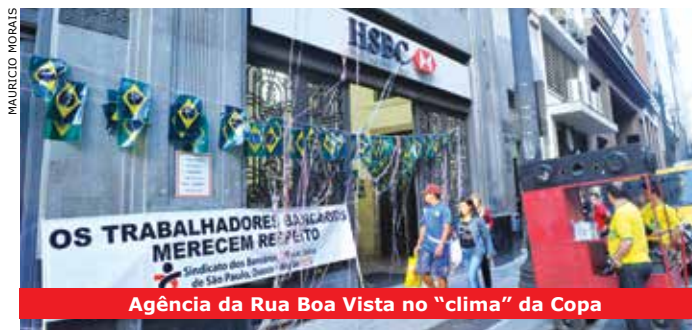
Agência da Rua Boa Vista no “clima” da Copa