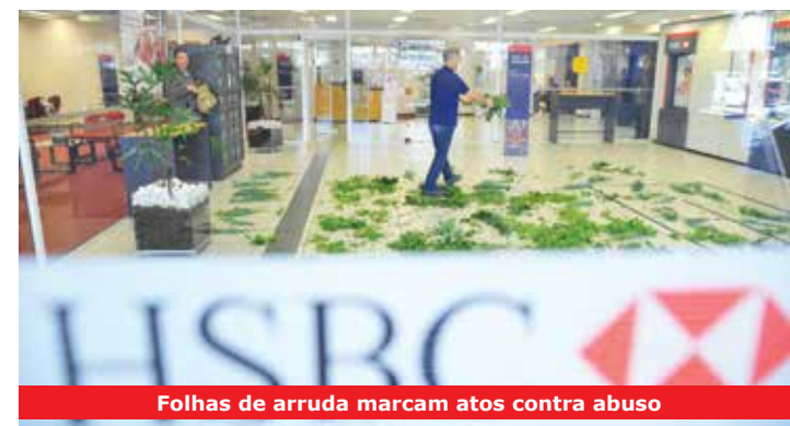
Folhas de arruda marcam atos contra abuso

As manifestações contra o fechamento de agências e demissão de funcionários continuam. Em junho, o ato promovido pelo Sindicato ocorreu em agência no Morumbi, zona sul da capital, para denunciar as más