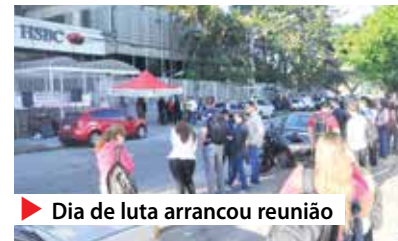
▶ Dia de luta arrancou reunião

Leia mais www.spbancarios.com.br/Noticias.aspx?id=8781 . ✿