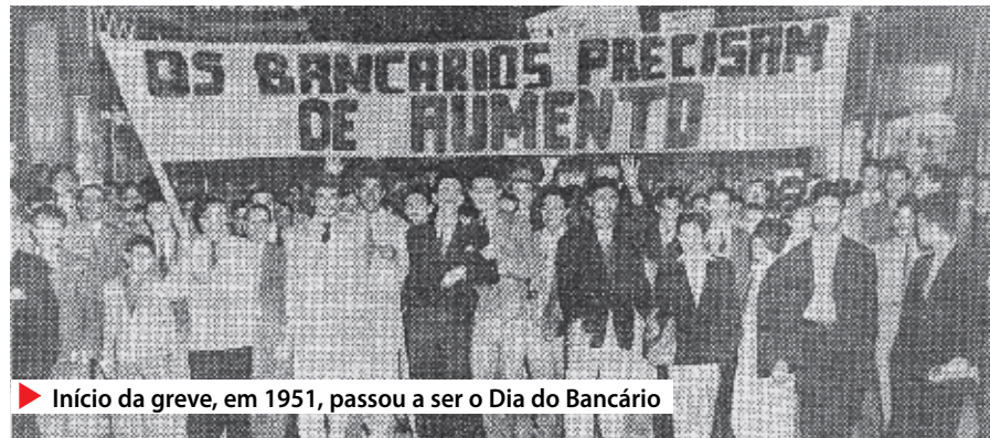
▶ Início da greve, em 1951, passou a ser o Dia do Bancário

Embora bancários de outros estados tenham aceitado a oferta patronal, os paulistas desprezaram o que considera-