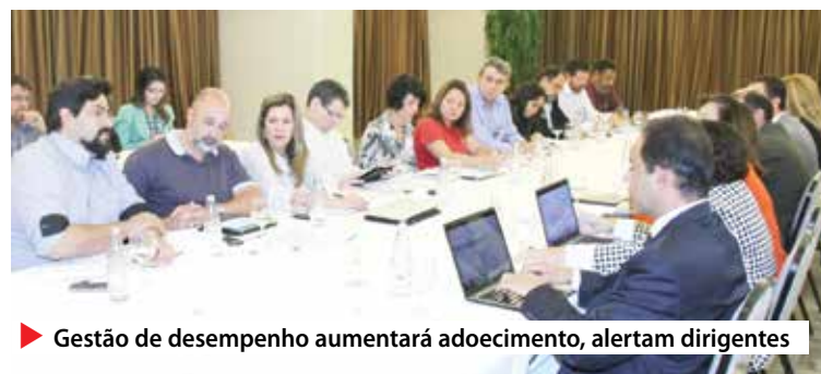
Gestão de desempenho aumentará adoecimento, alertam dirigentes

Na reunião realizada na quinta 21, em Brasília, os integrantes da Comissão Executiva dos Empregados expuseram denúncias dos setores em que o modelo foi implantado, entre elas: a institucionalização das metas individuais, a adoção de ranking para premiar quem tem melhor desempenho e o risco de descomissionamento. “Reforçamos que os empregados estão sobrecarregados e se a GDP for mantida, os casos de adoecimento