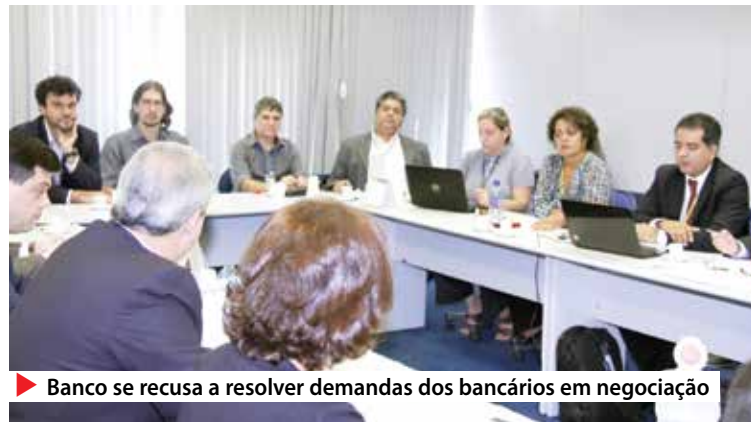
Banco se recusa a resolver demandas dos bancários em negociação

LEIA MAIS www.spbancarios.com.br/Noticias.aspx?id=8785