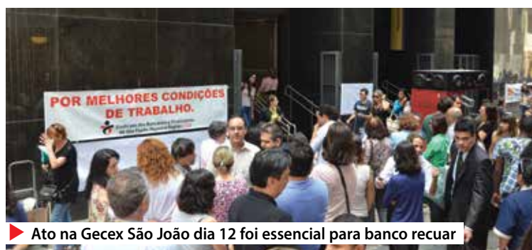
► Ato na Gecex São João dia 12 foi essencial para banco recuar

reforçou o compromisso de dialogar com o movimento sindical para buscar formas de minimizar os impactos aos envolvidos no processo.