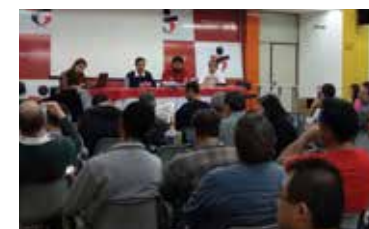
DELEGADOS IRÃO AMPLIAR ORGANIZAÇÃO

LEIA MAIS www.spbancarios.com.br/Noticias.aspx?id=9529