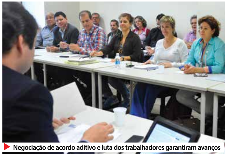
► Negociação de acordo aditivo e luta dos trabalhadores garantiram avanços

Bolsas – Das 2,5 mil bolsas, 500 serão para pós-graduação, nas quais o banco assume 50% do valor até o teto de R$ 480,43,