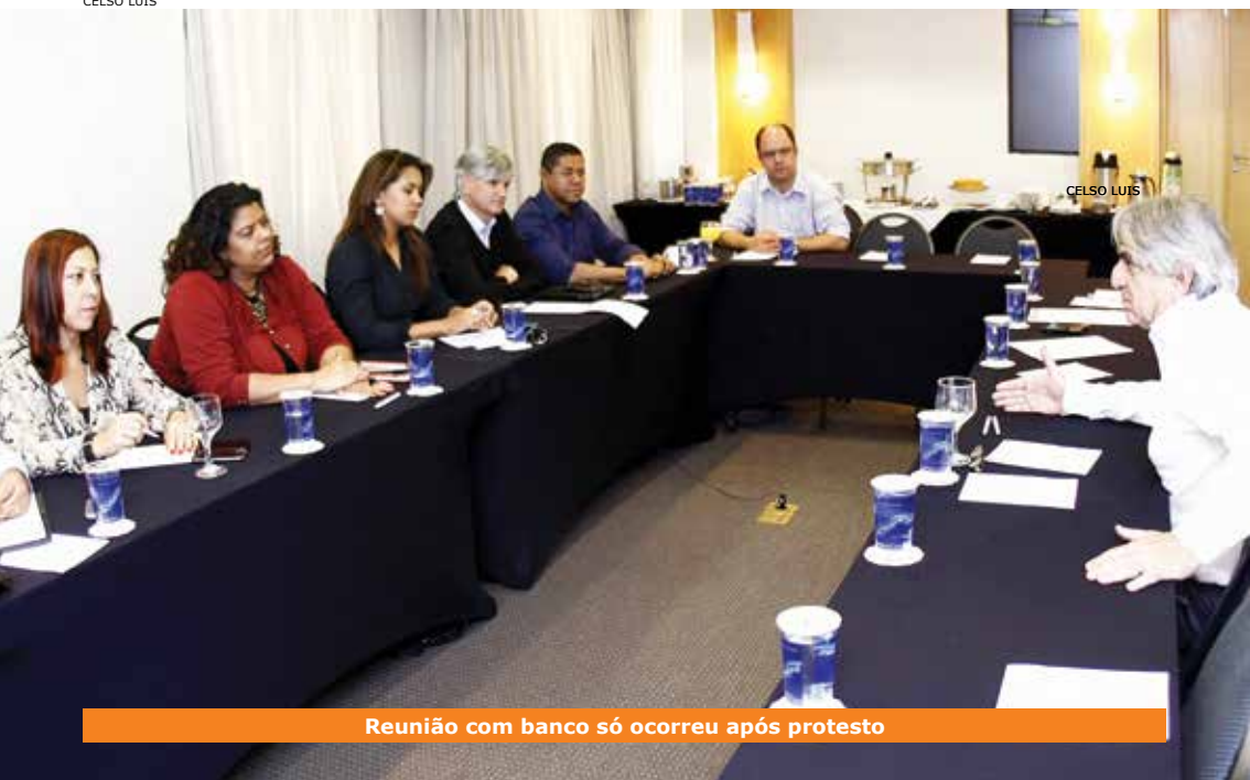
Reunião com banco só ocorreu após protesto

R epresentantes do HSBC garantiram que as demissões no banco britânico estão interrompidas até 31 de dezembro de 2014. Também negaram que a onda de dispensas atingirá 20% do quadro de funcionários e garantiram que a instituição seguirá investindo no país. Os anúncios foram feitos durante negociação com dirigentes sindicais em 18 de novembro para discutir a situação dos bancários envolvidos nos cortes em todo o país.