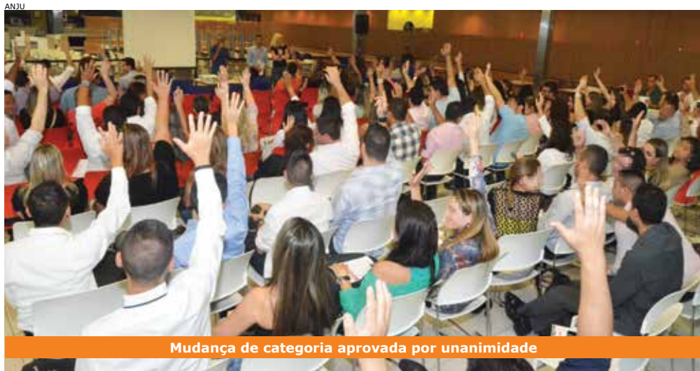
Mudança de categoria aprovada por unanimidade

Os funcionários da Fináustria e da Fina agora são bancários. A mudança foi ratificada em assembleia realizada em 25 de novembro, quando 112 empregados dessas empresas que integram o conglomerado do Itaú deliberaram por passar à categoria e usufruir dos direitos previstos em Convenção Coletiva de Trabalho (CCT).