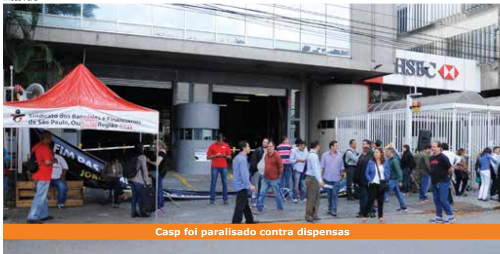
Casp foi paralisado contra dispensas

rancadas após intensa mobilização dos trabalhadores.