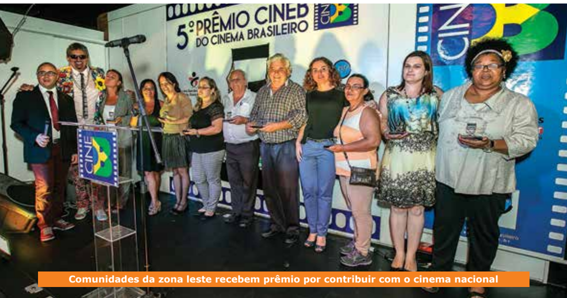
Comunidades da zona leste recebem prêmio por contribuir com o cinema nacional