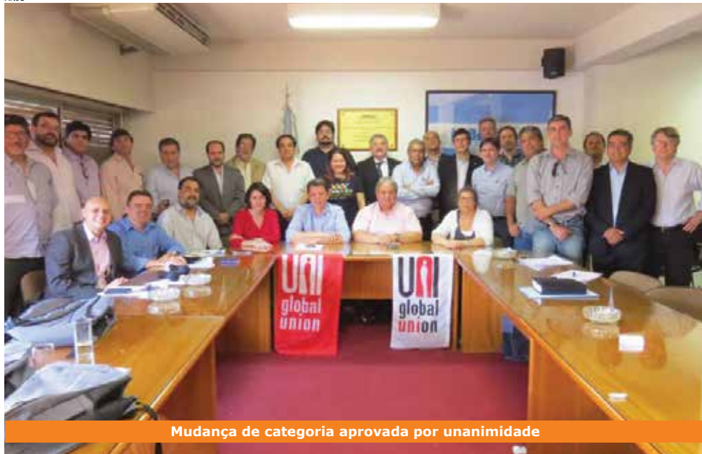
Mudança de categoria aprovada por unanimidade

Representantes de sindicatos de países como Brasil, Argentina, Peru, Uruguai, Costa Rica, Paraguai e Chile, que compõem a UNI Américas Finanças, criaram a Aliança Latino-Americana em Defesa dos Bancos Públicos, em encontro realizado em Buenos Aires dias 25 e 26 de novembro (foto).