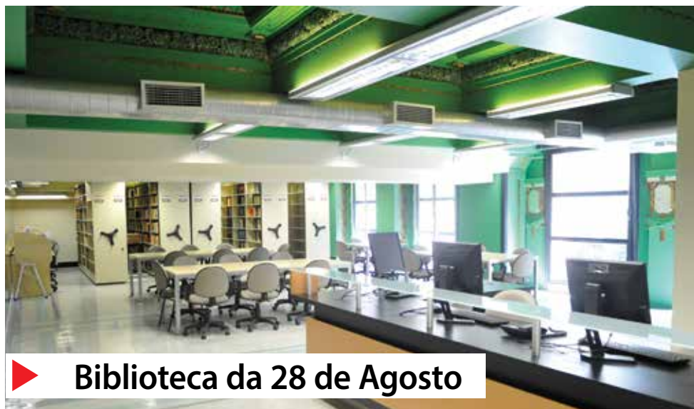
▶ Biblioteca da 28 de Agosto

ção de uma sociedade mais justa e igualitária, foi concretizado em 12 de fevereiro, quando o Diário Oficial da União divulgou o credenciamento da Faculdade 28 de Agosto de Ensino e Pesquisa.