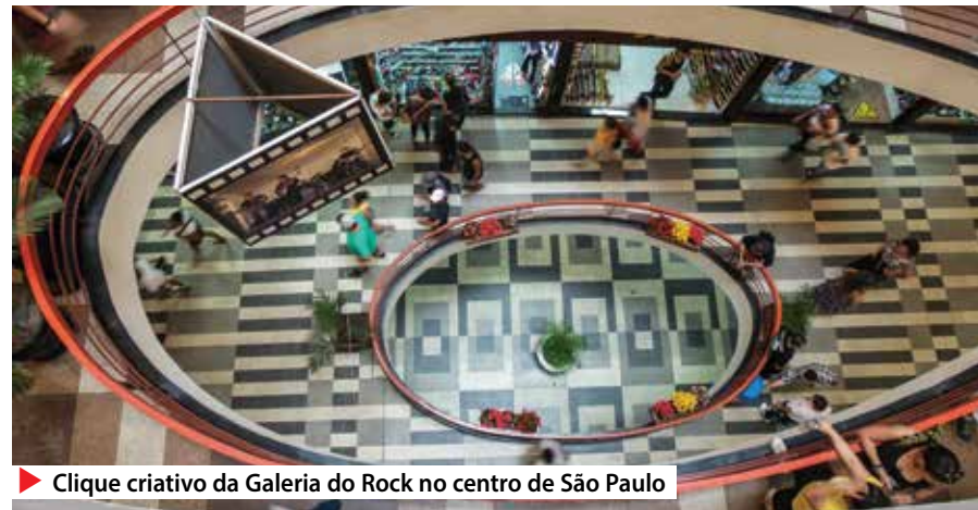
▶ Clique criativo da Galeria do Rock no centro de São Paulo

Em agosto, mês em que se comemora o Dia do Bancário (28), uma nova votação será feita para definir o campeão da mostra. Além da votação online , as dez imagens de cada mês também ganharão espaço no saguão do Edifício Martinelli, sede do Sindicato,