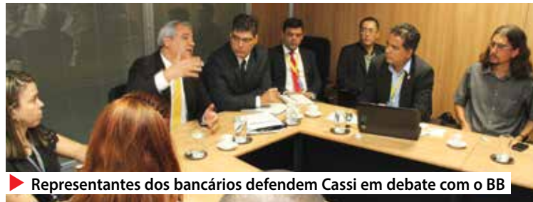
▶ Representantes dos bancários defendem Cassi em debate com o BB

Em mais uma reunião para discutir a Cassi, na terça 19, em Brasília, representantes dos trabalhadores voltaram a defender a manutenção do princípio de solidariedade, segundo o qual os usuários, independentemente da idade ou do número de dependentes, con-