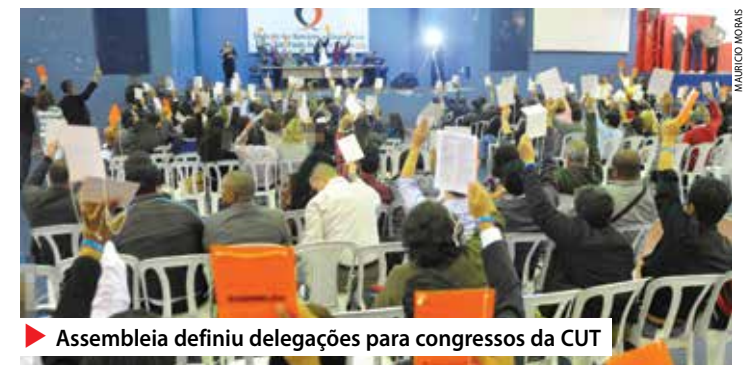
▶ Assembleia definiu delegações para congressos da CUT

Leia mais no www.spbancarios.com.br/Noticias.aspx?id=11267 . ✨