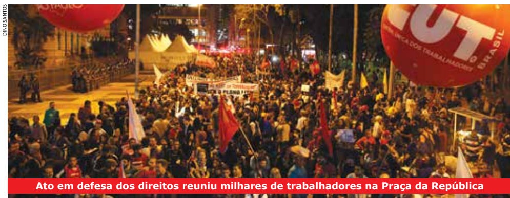
Ato em defesa dos direitos reuniu milhares de trabalhadores na Praça da República

Mobilização é contra PL da terceirização, pelo fim do fator previdenciário, reforma política e em defesa da democracia