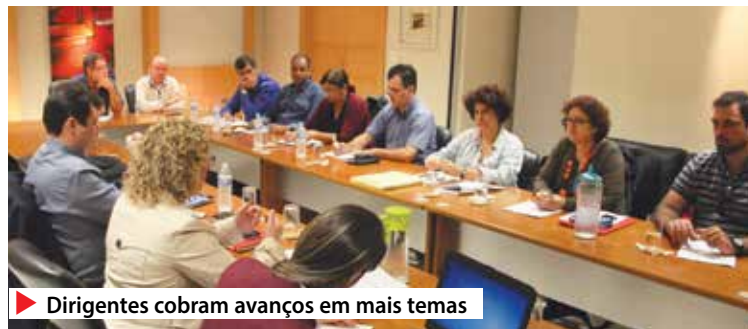
▶ Dirigentes cobram avanços em mais temas

Bolsas de estudo – Os representantes do Santander informaram que por problemas no sistema as 800 bolsas de estudos para pós-graduação não foram