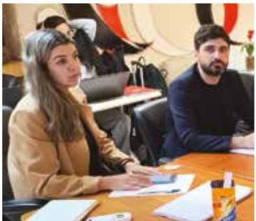
Representação dos empregados da Caixa na negociação com o banco público

As negociações para renovação do Acordo Coletivo de Trabalho dos empregados da Caixa terminaram na noite de sábado 31, com uma série de avanços.