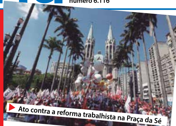
▶ Ato contra a reforma trabalhista na Praça da Sé