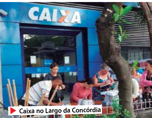
▶ Caixa no Largo da Concórdia