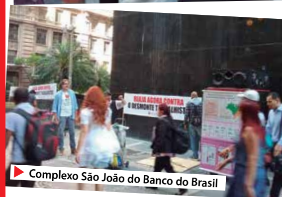
▶ Complexo São João do Banco do Brasil