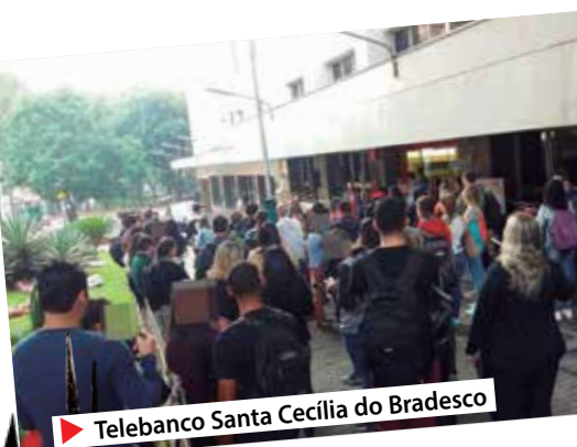
▶ Telebanco Santa Cecília do Bradesco