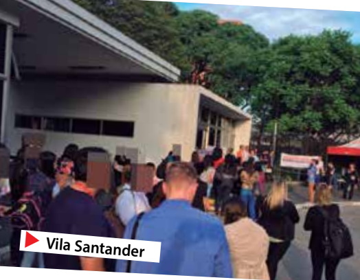
▶ Vila Santander