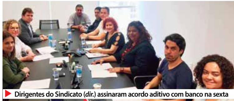
▶ Dirigentes do Sindicato ( dir. ) assinaram acordo aditivo com banco na sexta

O acordo prevê a manutenção das conquistas anteriores e garante uma nova regra para o intervalo entre as pausas, com períodos maiores entre as pausas break (20 minutos) e extra break (10 minutos), e redução da aderência mínima para atingir a AQO (Avaliação de Qualidade Operacional). Também assegura que a