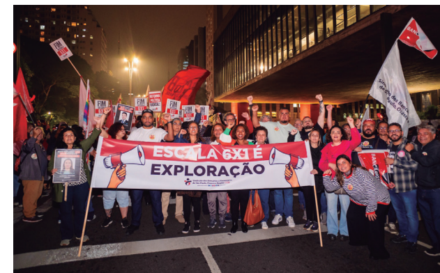
Bancários presentes em ato pelo fim da escala 6x1