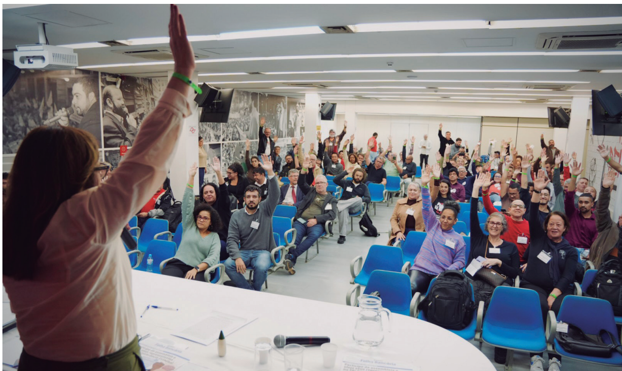
Delegação que vai representar os bancários de São Paulo, Osasco e região foi eleita com 94,24% dos votos

“Saímos desta assembleia unidos, mobilizados e fortalecidos para construirmos mais uma Campanha Nacional dos Bancários vitoriosa”, conclui a presidenta do Sindicato.