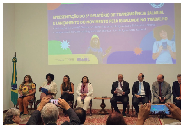
Sindicato faz parte do Comitê Gestor do Plano Nacional de Igualdade Salarial e Laboral