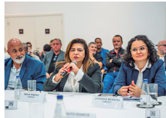
Bancários cobraram dos bancos medidas efetivas contra o adoecimento