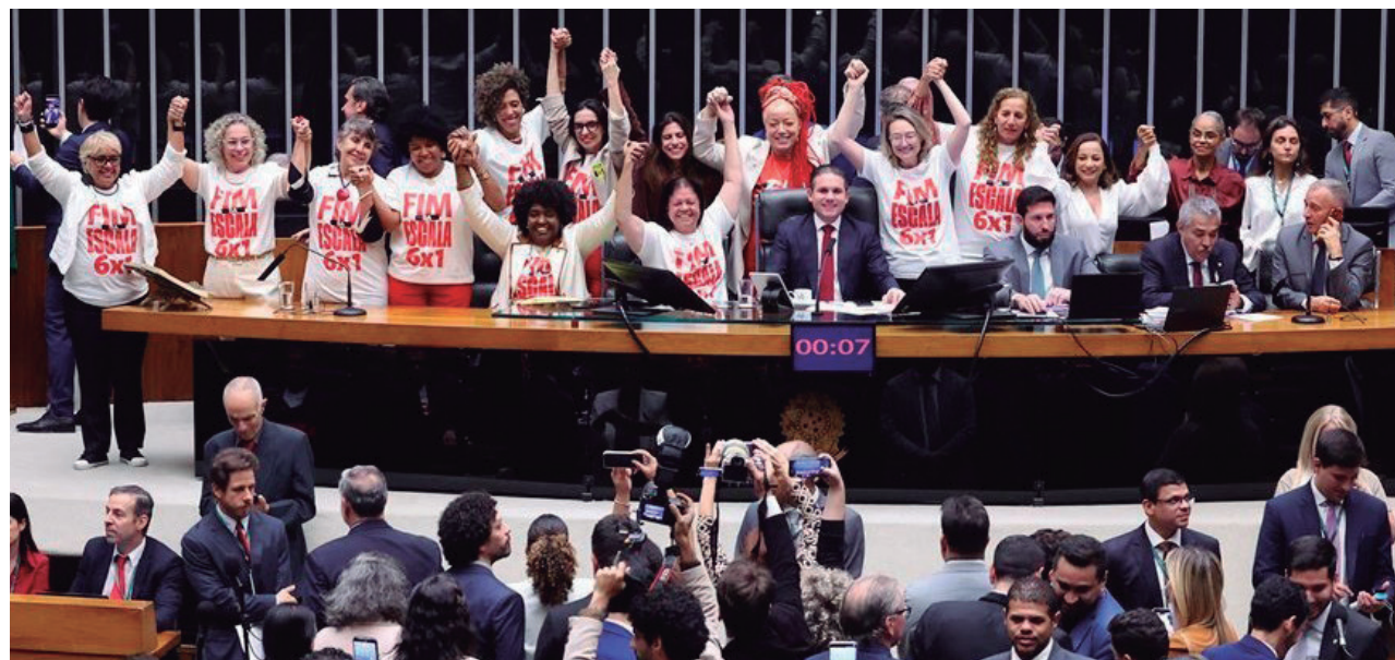
Parlamentares comemoram a aprovação do fim da escala 6x1 no plenário da Câmara