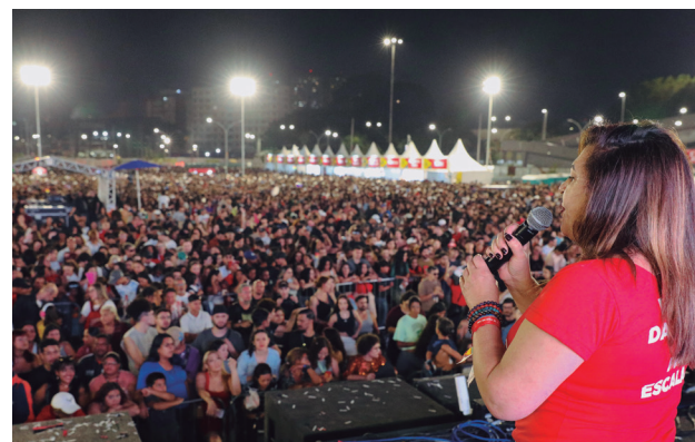
1º de Maio de São Bernardo do Campo reuniu mais de 75 mil pessoas