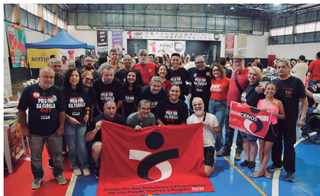
Bancários presentes no 1º de Maio de Osasco